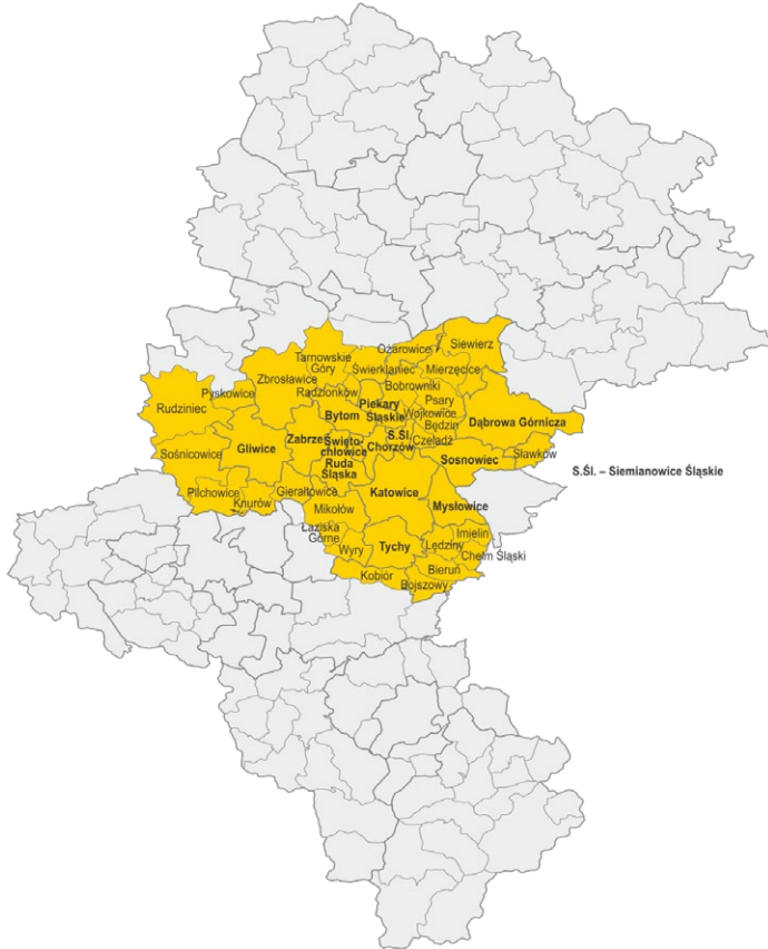
Rysunek 1. Obszar GZM (stan na 1 stycznia 2024 r.)