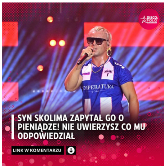
Rys. 2. Clickbaitowy nagłówek – Skolim