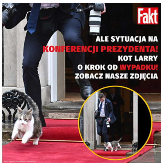
Rys. 1. Clickbaitowy nagłówek – Kot Larry

Przykładem nagłówka o wyraźnie clickbaitowym charakterze jest post opublikowany 14 stycznia 2026 roku na koncie społecznościowym Fakt.pl: „Kot Larry w centrum zamieszania na konferencji prezydenta! Prawie doszło do wypadku – mamy zdjęcia!” (rys. 1).