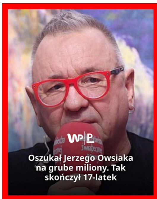
Rys. 3. Clickbaitowy nagłówek – Jerzy Owsiaak

Przykładem posta o wyraźnym potencjale clickbaitowym jest publikacja zamieszczona 19 stycznia 2026 roku na fanpage’u Popularne, odnosząca się do rzekomego skandalu związanego z Wielką Orkiestrą Świątecznej Pomocy: „Oszukał Jerzego Owsiaaka na grube miliony. Tak skończył 17-latek” (rys. 3).