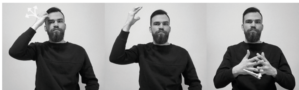
Il. 7. Znak PROROK według Słownika liturgicznego języka migowego

Drugi rodzaj dotyczy znaków złożonych, w przypadku których tłumacze używali jednego ze znaków składowych słowa zaczerpniętego wprost ze słownika: samodzielnie lub w kombinacji z innym znakiem. Na przykład znak PROROK według słownika składa się z pierwszej części będącej znakiem MĄDROŚĆ i z drugiej artykułowanej poprzez wsunięcie palców jednej dłoni pomiędzy palce drugiej (il. 7). Tymczasem część tłumaczy migała tylko drugą część znaku (il. 8) albo łączyła go ze znakiem MĘŻCZYZNA (w odniesieniu do jednego proroka – il. 9) lub LUDZIE (w odniesieniu do więcej niż jednego proroka – il. 10).