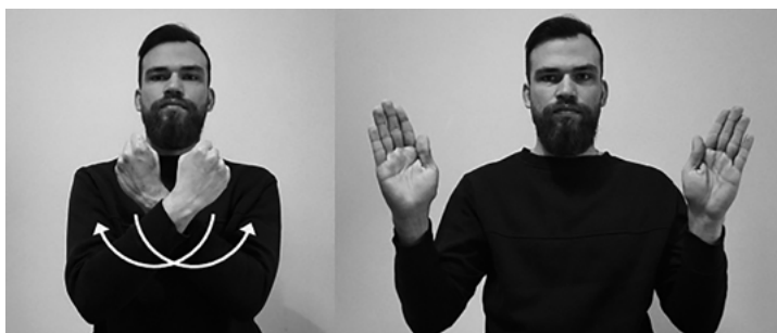
Il. 5. Znak ZBAWIENIE według Słownika liturgicznego języka migowego

2. Znaki nawiązujące do formy słownikowej. Do tej grupy przypisano dwa rodzaje znaków. Pierwszy to znaki, których artykulacja różni się od słownikowej, lecz w na tyle ograniczonym stopniu, że pozostaje zauważalne podobieństwo do formy słownikowej. Najczęściej wówczas zmienia się tylko jeden parametr znaku. Na przykład w znaku ZBAWIENIE zmieniał się tylko układ dłoni w końcowej fazie artykulacji: w wersji słownikowej po rozłożeniu rąk palce prostują się (il. 5), natomiast część tłumaczy po rozłożeniu rąk pozostawiała pięści zaciśnięte (il. 6).