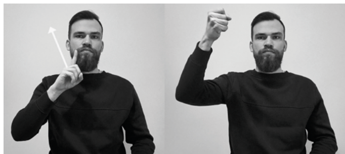
Il. 11. Znak ZMARTWYCHWSTANIE według Słownika liturgicznego języka migowego