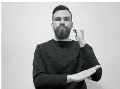
Il. 1. Wariant znaku JÓZEF

W niniejszej pracy znaki języka migowego zanotowano przy pomocy glos, zapisywanych wielkimi literami (na przykład KOŚCIÓŁ, DOM), będącymi ekwiwalentami tych znaków w języku polskim. Pod jedną glosą może się kryć kilka znaków, o ile mają ten sam odpowiednik w polszczyźnie (na przykład glosa JÓZEF oznacza wszelkie znaki w języku migowym mające znaczenie antropionimu św. Józef mąż Maryi , por. il. 1–2). Brzmienie glos dotyczących słownictwa religijnego zaczerpnięte jest ze Słownika liturgicznego języka migowego Bogdana Szczepankowskiego z 2000 roku.