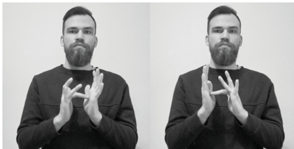
Il. 3. Znak JEZUS