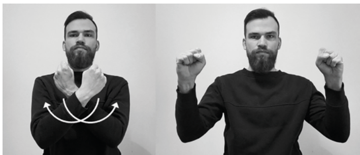
Il. 6. Znak ZBAWIENIE migany przez część tłumaczy

Drugi rodzaj dotyczy znaków złożonych, w przypadku których tłumacze używali jednego ze znaków składowych słowa zaczerpniętego wprost ze słownika: samodzielnie lub w kombinacji z innym znakiem. Na przykład znak PROROK według słownika składa się z pierwszej części będącej znakiem MĄDROŚĆ i z drugiej artykułowanej poprzez wsunięcie palców jednej dłoni pomiędzy palce drugiej (il. 7). Tymczasem część tłumaczy migała tylko drugą część znaku (il. 8) albo łączyła go ze znakiem MĘŻCZYZNA (w odniesieniu do jednego proroka – il. 9) lub LUDZIE (w odniesieniu do więcej niż jednego proroka – il. 10).