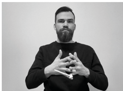
Il. 8. Znak PROROK migany przez część tłumaczy