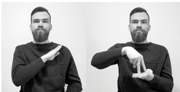
Il. 12. Znak ZMARTWYCHWSTANIE migany przez część tłumaczy

Na wykresie 1 zamieszczone są informacje odzwierciedlające, jaki procent znaków, w różnym stopniu nawiązujących do form słownika, został użyty przez poszczególnych tłumaczy. Tłumaczy oznaczono numerami w kolejności losowej.