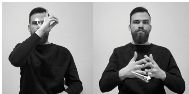
Il. 10. Znak PROROK (kilku) migany przez część tłumaczy