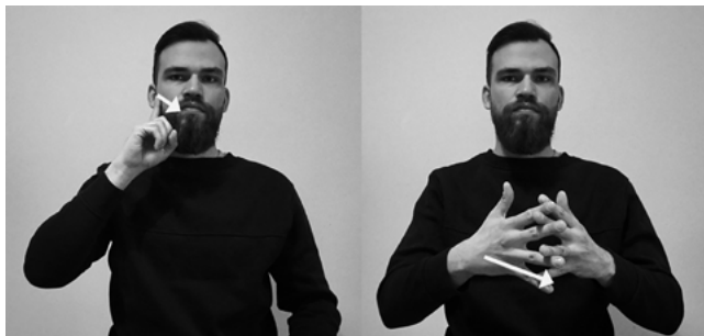
Il. 9. Znak PROROK (jeden) migany przez część tłumaczy