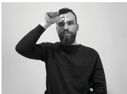
Il. 4. Znak CHRYSSTUS

2. Znaki nawiązujące do formy słownikowej. Do tej grupy przypisano dwa rodzaje znaków. Pierwszy to znaki, których artykulacja różni się od słownikowej, lecz w na tyle ograniczonym stopniu, że pozostaje zauważalne podobieństwo do formy słownikowej. Najczęściej wówczas zmienia się tylko jeden parametr znaku. Na przykład w znaku ZBAWIENIE zmieniał się tylko układ dłoni w końcowej fazie artykulacji: w wersji słownikowej po rozłożeniu rąk palce prostują się (il. 5), natomiast część tłumaczy po rozłożeniu rąk pozostawiała pięści zaciśnięte (il. 6).