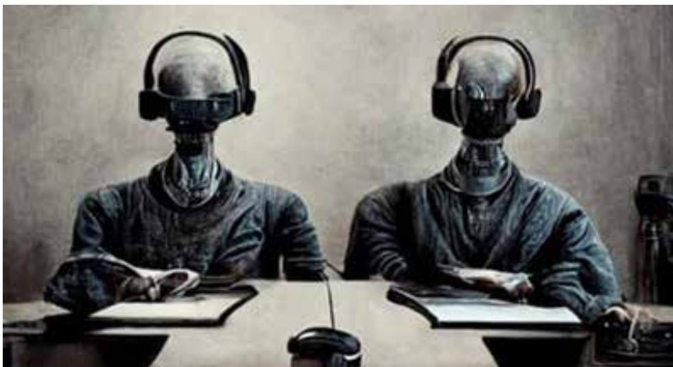
Rysunek 2. Ilustracja wygenerowana przez Midjourney na potrzeby artykułu portalu Rzeczpospolita.pl

Natomiast portal Rzeczpospolita.pl dokonał eksperymentu, publikując artykuł napisany oraz zilustrowany przez AI. Poniżej obraz stworzony przez algorytm Midjourney, który miał za zadanie zwizualizować pracę w przyszłości oraz chatboty 26 .