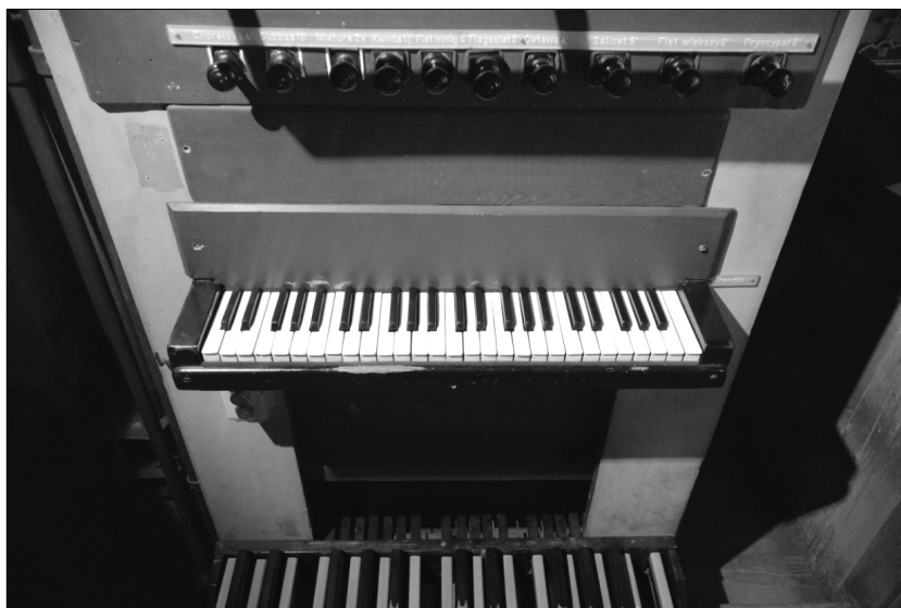
Fot. 3. Stół gry organów w kościele pw. św. Wojciecha i Matki Bożej Bolesnej w Modlnicy, stan obecny