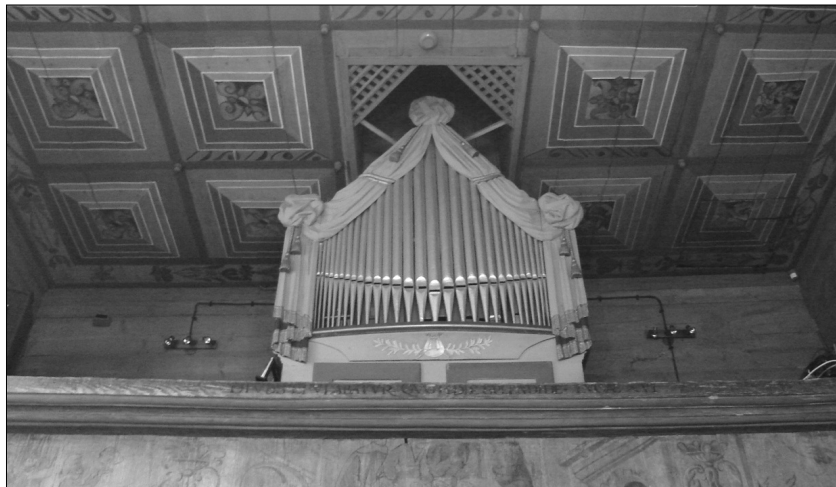
Fot. 2. Prospekt organowy w kościele pw. św. Wojciecha i Matki Bożej Bolesnej w Modlnicy, stan obecny