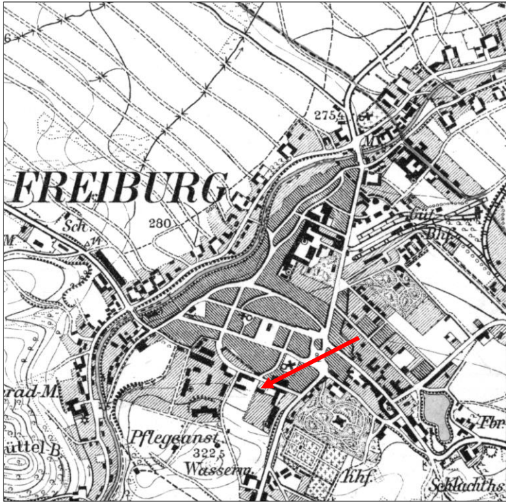
Rysunek 2. Mapa Świebodzic (fragment większej całości) z 1907 r. Strzałką oznaczono Dom Zakonny Kongregacji (Zgromadzenia) Sióstr św. Elżbiety (dokładny adres: Marienstraße 11). Czerwoną linią oznaczono dawną Marienstraße (obecnie ul. Marszałka Józefa Piłsudskiego) 8