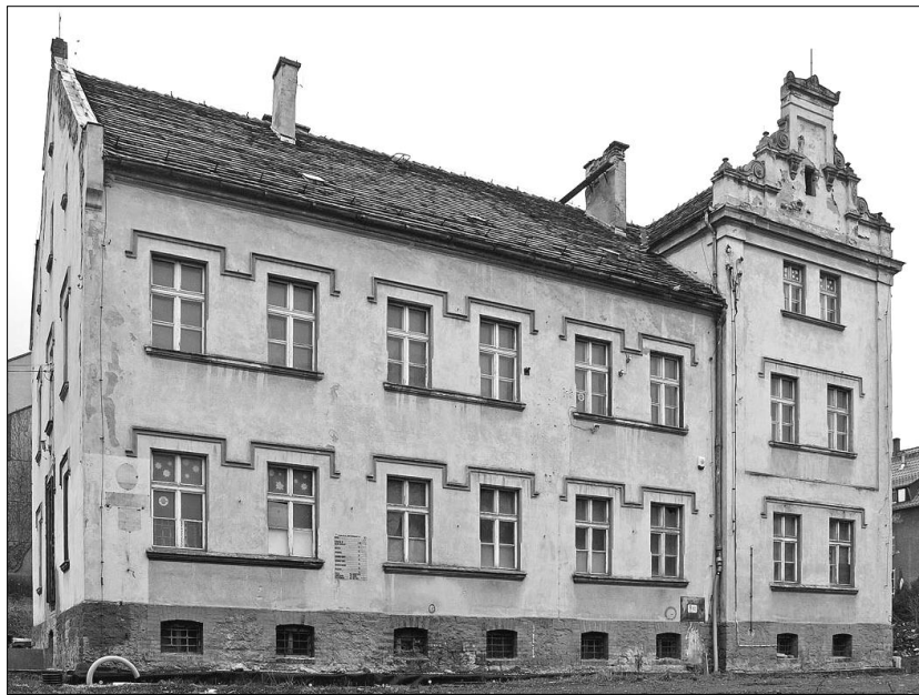
Rysunek 5. Dawny dom zakonny (siedziba w latach 1866-1945). Siedziba Zgromadzenia (Kongregacji) Sióstr św. Elżbiety w Świebodzicach (widok z marca 2017 r., budynek był wówczas w remoncie). Parcela, na której stoi oznaczona jest na rysunku 4. czarną strzałką po prawej stronie 13 .

a szóstym rokiem życia pochodzące z ubogich rodzin. Przedszkole było czynne w dni powszednie od godz. 9.00 do godz. 16.00, a najpóźniej do godz. 17.00 (dane z początku lat 30. XX wieku). Podopieczni otrzymywali tam opiekę (nadzór), nauczanie i wyżywienie. Siostry pomagały też w pracy duszpasterskiej w pobliskiej parafii rzymskokatolickiej pod wezwaniem św. Mikołaja ( Die Pfarrei zum Heiligen Nikolaus ) 14 .