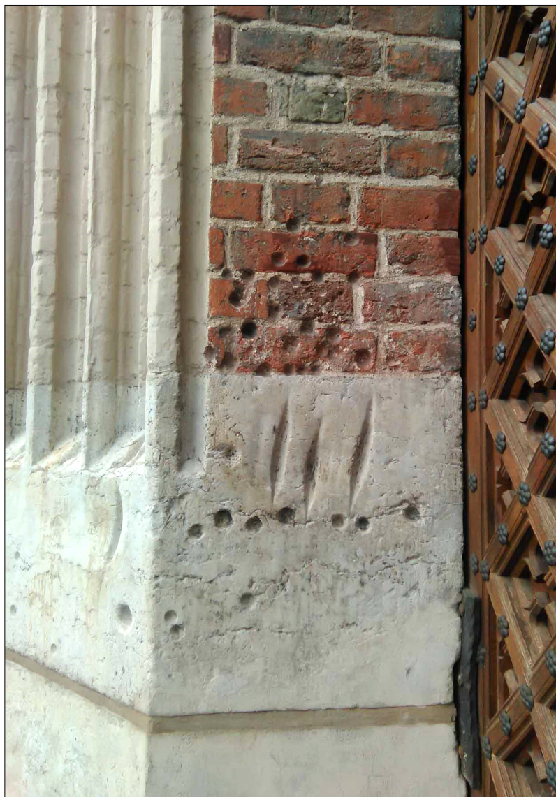
Ryc. 7. Ślady na portalu kościoła św. Jana w Gdańsku