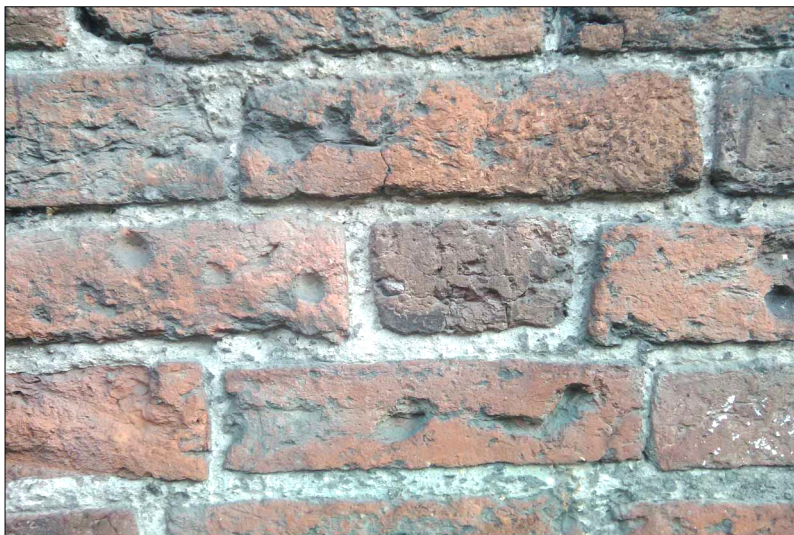
Ryc. 4. Ślady na północnej ścianie świątyni – Ornetka