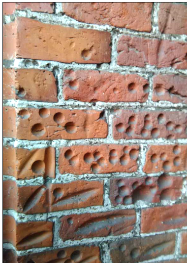
Ryc. 3. Duża ilość śladów zogniskowana w portalu – Susz