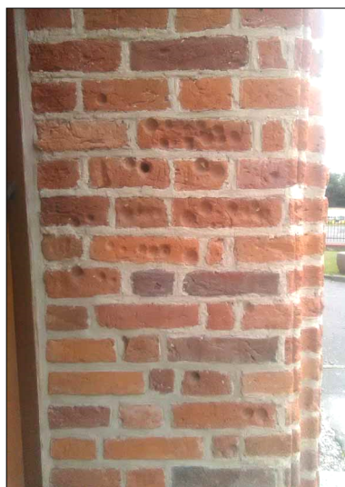
Ryc. 6. Wejście główne do kościoła w Rakowcu