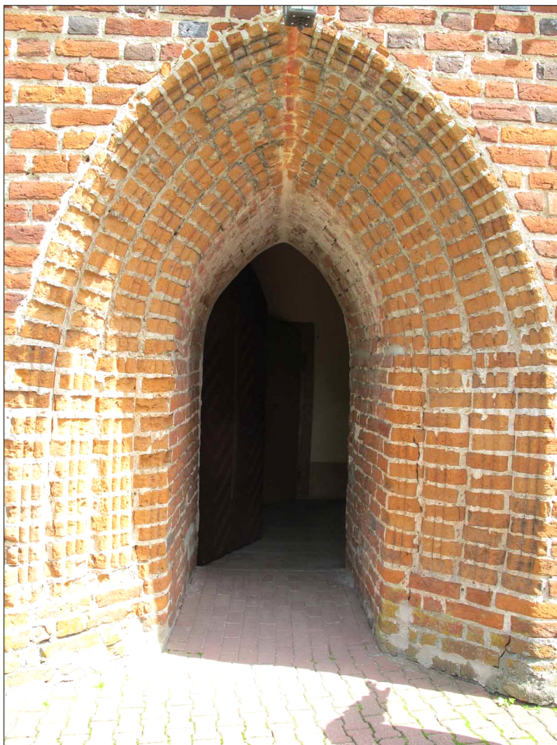
Ryc. 8. Portal główny kościoła w Kwietniewie