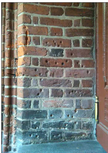
Ryc. 5. Ślady na portalu zach. kościół św. Mateusza w Starogardzie Gdańskim