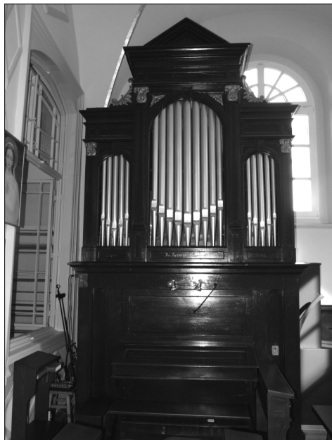
Ilustracja 2. Organy w kościele św. Tomasza w Krakowie – widok ogólny. Stan na 2013 r.