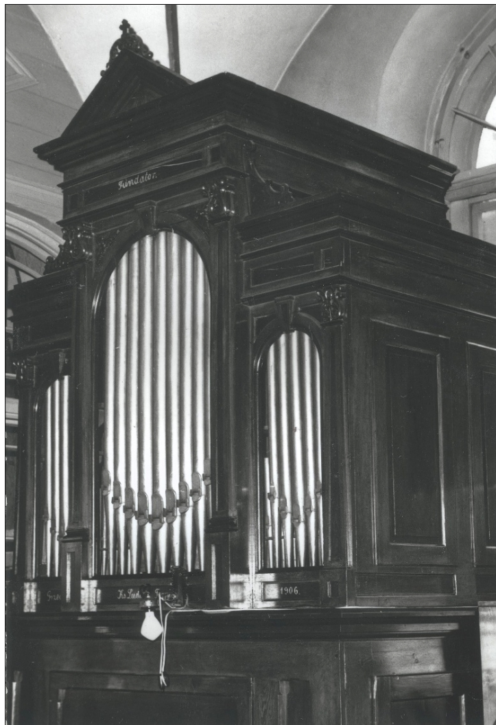
Ilustracja 1. Organy w kościele św. Tomasza w Krakowie – widok ogólny. Stan na 1984 r.

całkowicie wyrugowanych w związku z powstawaniem organów o rozwiązaniach technicznych uchodzących wówczas za nowoczesne.