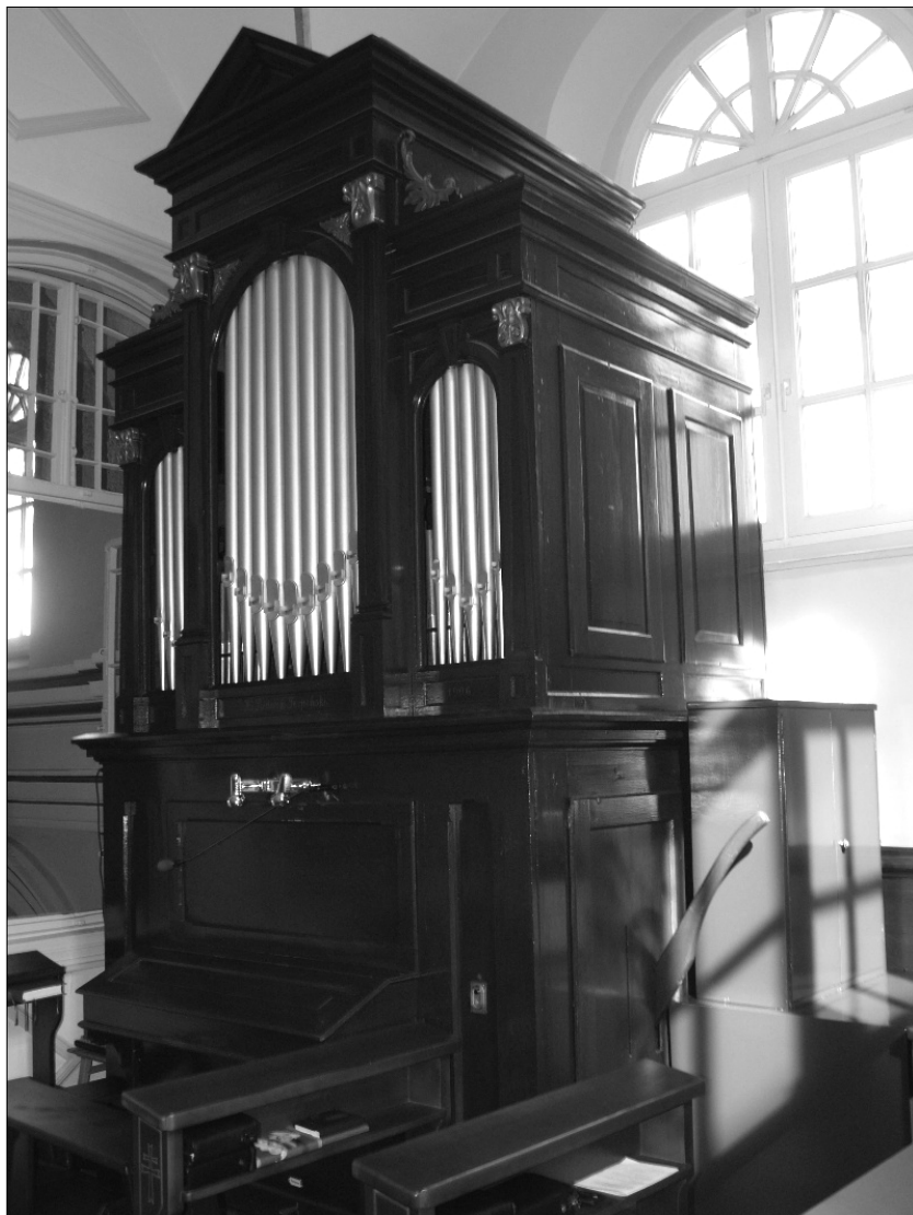
Ilustracja 4. Organy w kościele św. Tomasza w Krakowie – urządzenie do kalikowania. Stan na 2013 r.