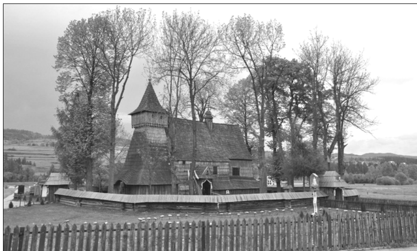
Fot 2. Kościół św. Michała Archanioła w Dębnie