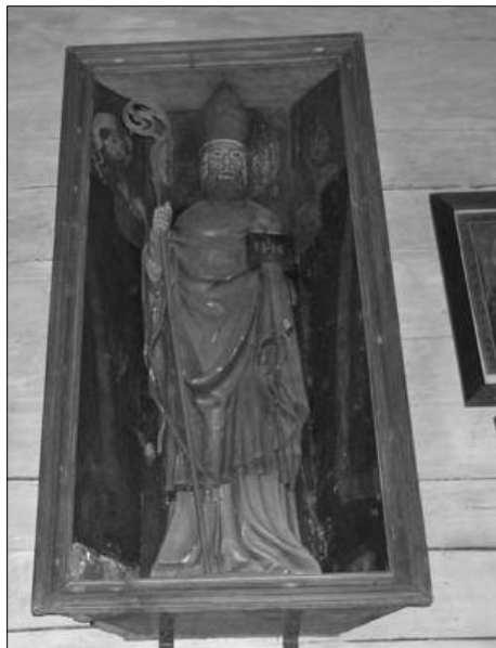
Fot 1. Rzeźba św. Mikołaja bp. i w.