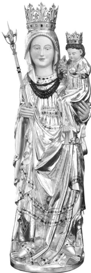
Fot. 4. Figura Matki Bożej z Dzieciątkiem Jezus

jest to, iż świątynia parafialna otrzymuje nowe uposażenie w 1333 r., co było efektem nadania niemieckiego prawa miejskiego przez Ludźmierz w tym samym roku 59 . Co ciekawe parafia ta nie została wymieniona ani raz w Monumenta Poloniae Vaticana . Aczkolwiek odnajdujemy o niej wzmianki w Kodeksie Dyplomatycznym Katedry Krakowskiej św. Wacława 60 . Od 1353 r. wieś została afiliowana do parafii Nowy Targ, następnie do parafii Krauszów. Jan Długosz wspomina, że za jego czasów parafia posiadała na nowo samodzielne oraz pełne prawa parafialne. Ludźmierz w XIII w. stał się lokalnym miejscem na mapie Małopolski, gdzie szczególnie rozwinął się kult Matki Bożej. Wzmacnia tą tezę również samo wezwanie kościoła do Najświętszej Marii Panny. Ponadto do dziś zachowała się figura łaskami słynąca Matki Bożej z Dzieciątkiem Jezus, do której mieszkańcy całego Podhala składali swe modlitwy oraz prośby w różnorodnych intencjach. Kościół w Ludźmierzu stał się w kolejnych latach jednym z ważniejszych punktów religijnych na mapach pielgrzymkowych. Uważa się, że przez stulecia sanktuarium to było i jest jednym z najczęściej nawiedzanych świętych miejsc, tuż po Kalwarii Zebrzydowskiej.