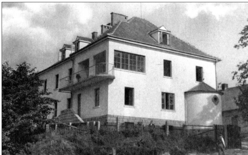
Dom Sióstr Miłosierdzia w Zebrzydowicach k. Kalwarii