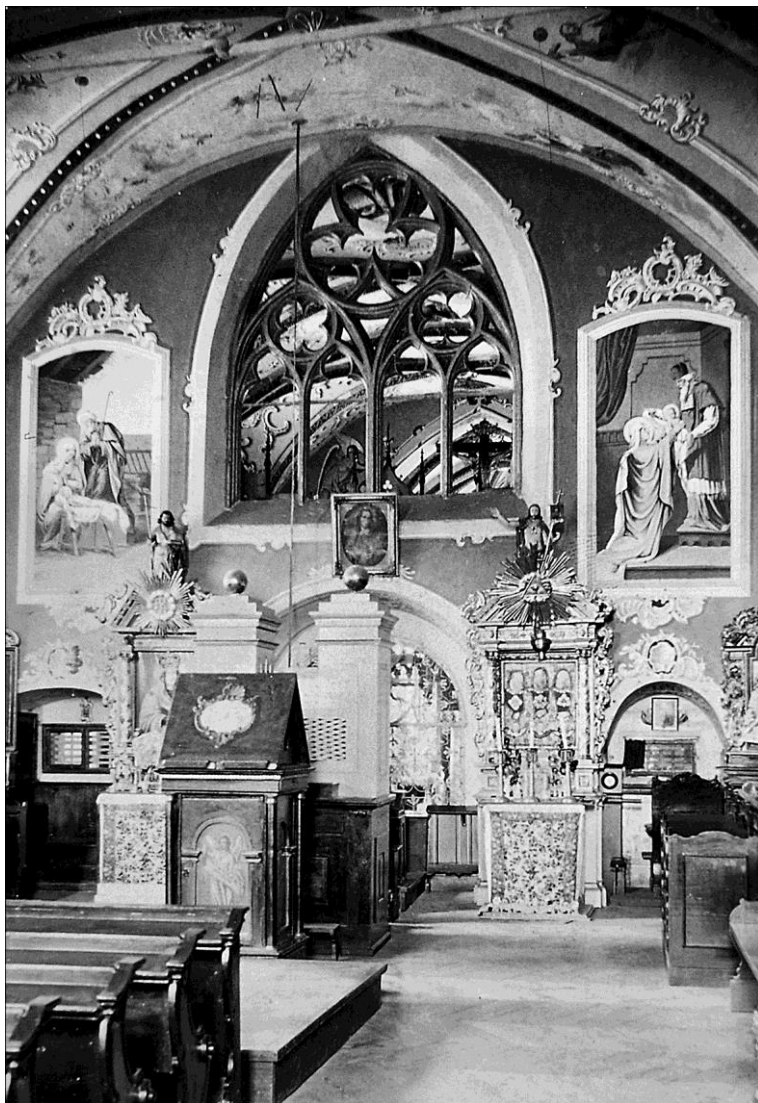
Stary Sącz, wnętrze chóru zakonnego z widokiem na pozytyw (fot. z ok. 1891 r.)