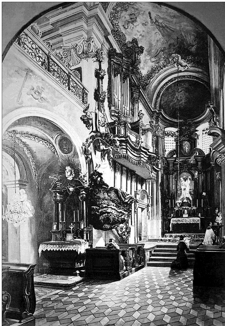
Kraków, wnętrze kościoła klasztornego z widokiem na prospekt organowy (obraz z 1880 lub 1881 r.)