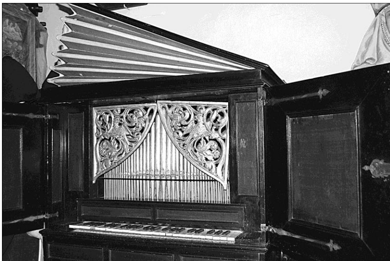
Stary Sącz, większy pozytyw szkatulny (stan obecny)