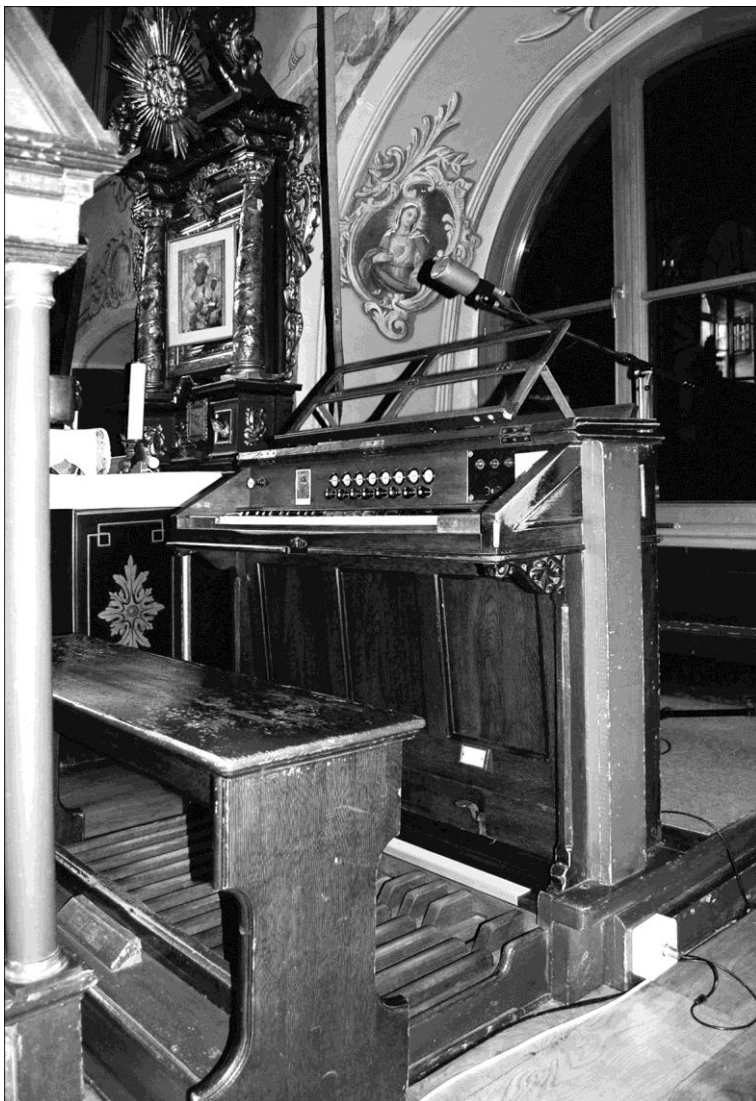
Stary Sącz, stół gry organów w kościele klasztornym (stan obecny)