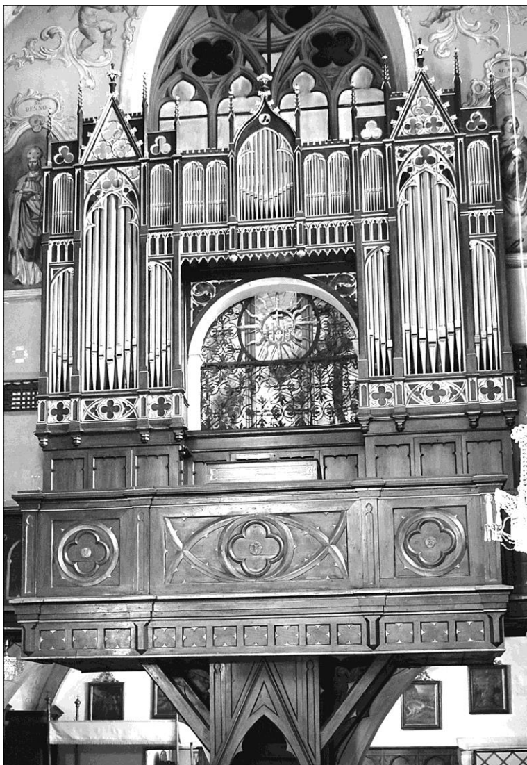
Stary Sącz, prospekt organowy w kościele klasztornym (stan obecny)