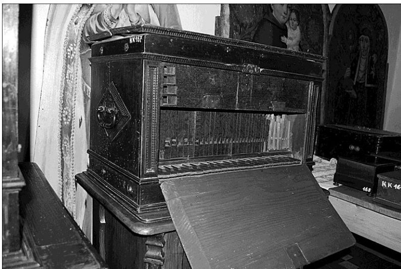
Stary Sącz, mniejszy pozytyw szkatulny (stan obecny)