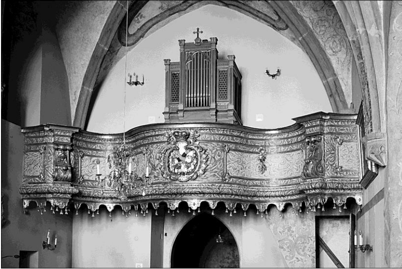
Stary Sącz, prospekt organowy w kaplicy św. Kingi (stan obecny)