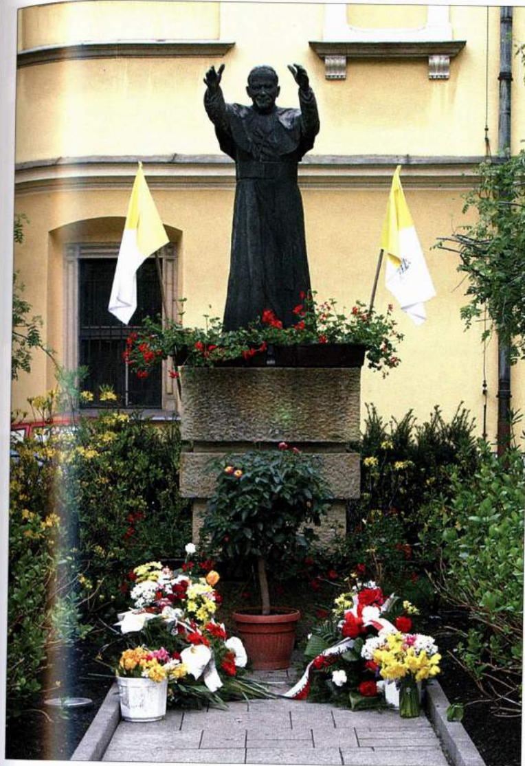
Dziedziniec Pałacu Arcybiskupów Krakowskich – najstarszy pomnik papieża w Krakowie autorstwa włoskiej rzeźbiarki Jole Sensi Croci (1980).