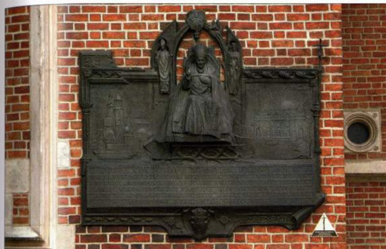
Bazylika Mariacka w Krakowie – tablica przy wejściu upamiętnia Mszę św. na Rynku Krakowskim i beatyfikację bł. Anieli Salawy (13 VIII 1991 r.).