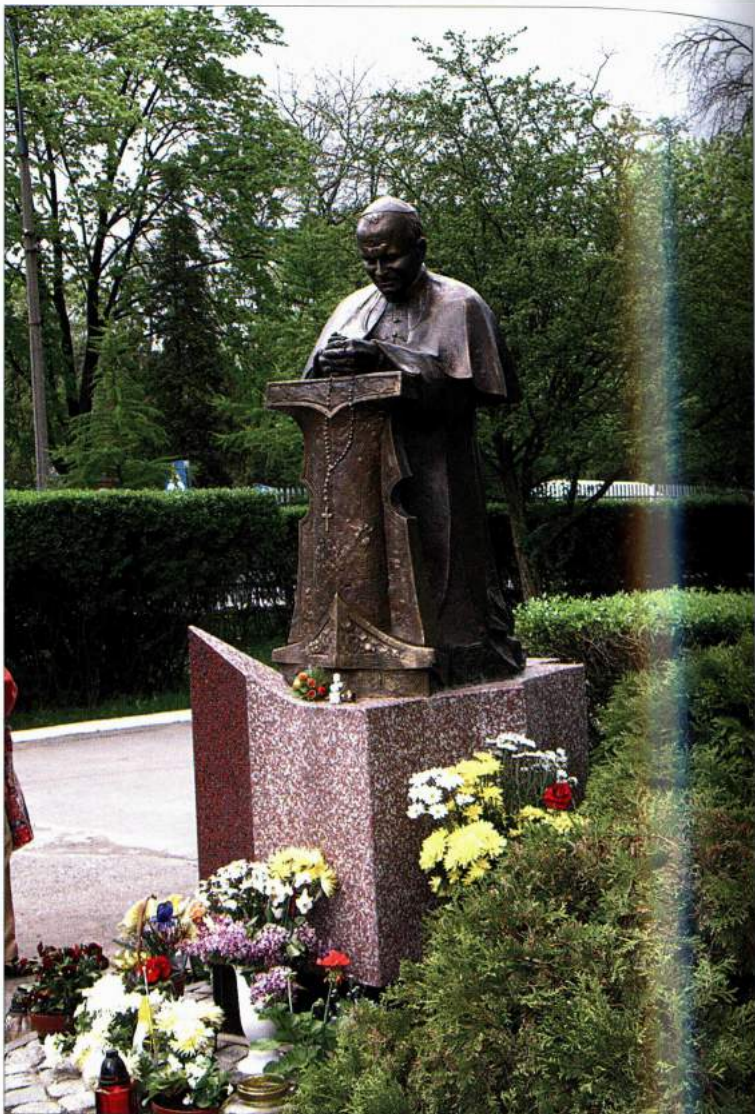
Cmentarz Rakowicki w Krakowie – figura wykonana przez S. Kowalówkę przy grobowcu rodziny Wojtyłów i Kaczorowskich.