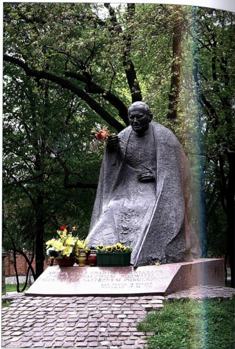
Park Strzelecki przy ul. Lubicz w Krakowie. Pomnik ufundowany przez krakowskie Bractwo Kurkowe, odsłonięty 1 lipca 2000 r.