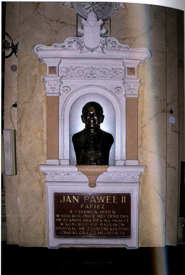
Kaplica MB Częstochowskiej w kościele oo. Paulinów na Skałce – popiersie dłuta A. Wojnara, pamiątka spotkania z ludźmi kultury i nauki oraz z młodzieżą w 1979 r.