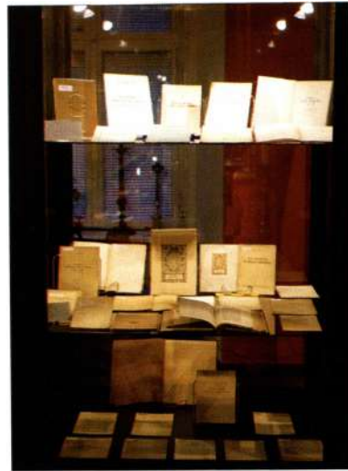
Fragment ekspozycji jubileuszowej