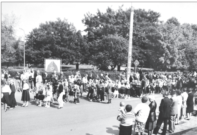
Fot. 5. Kondukt żałobny – widoczna młodzież szkolna wraz z nauczycielami