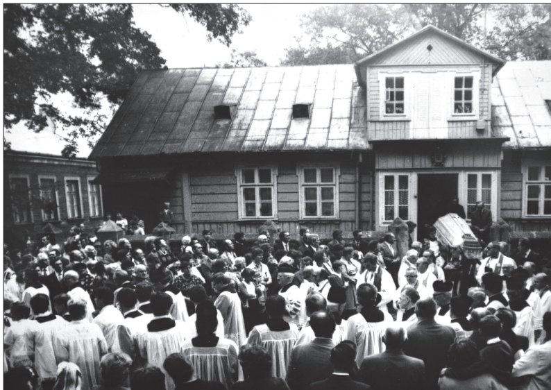
Fot. 2. Eksporta ciała ks. Soszyńskiego z plebanii do kościoła parafialnego