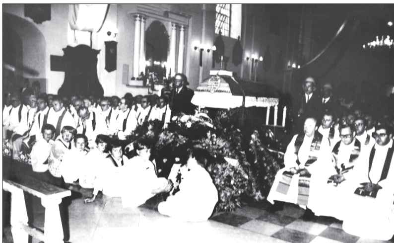
Fot. 3. Msza św. pogrzebowa