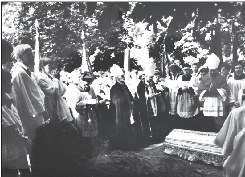
Fot. 6. Obrzędy pogrzebowe na cmentarzu parafialnym