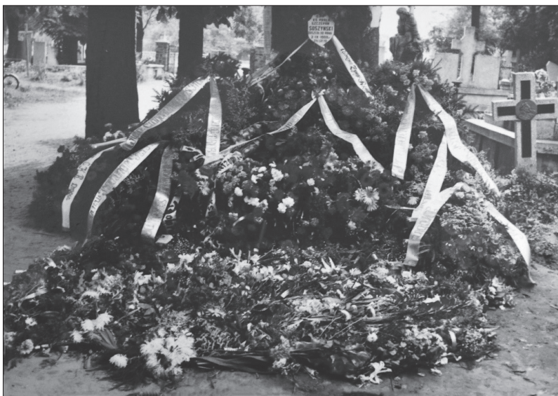
Fot. 7. Grobowiec kapłański na cmentarzu parafialnym w Drobinie