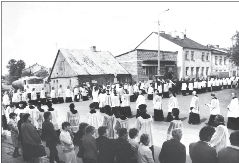
Fot. 4. Kondukt żałobny na rogu ulic Piłsudskiego oraz Rynek