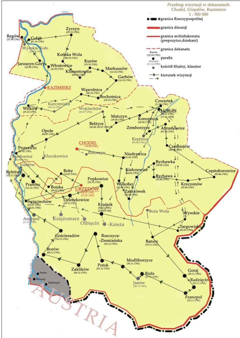
Mapa 2. Przebieg wizytacji w dekanatach: Chodel, Urzędów, Kazimierz