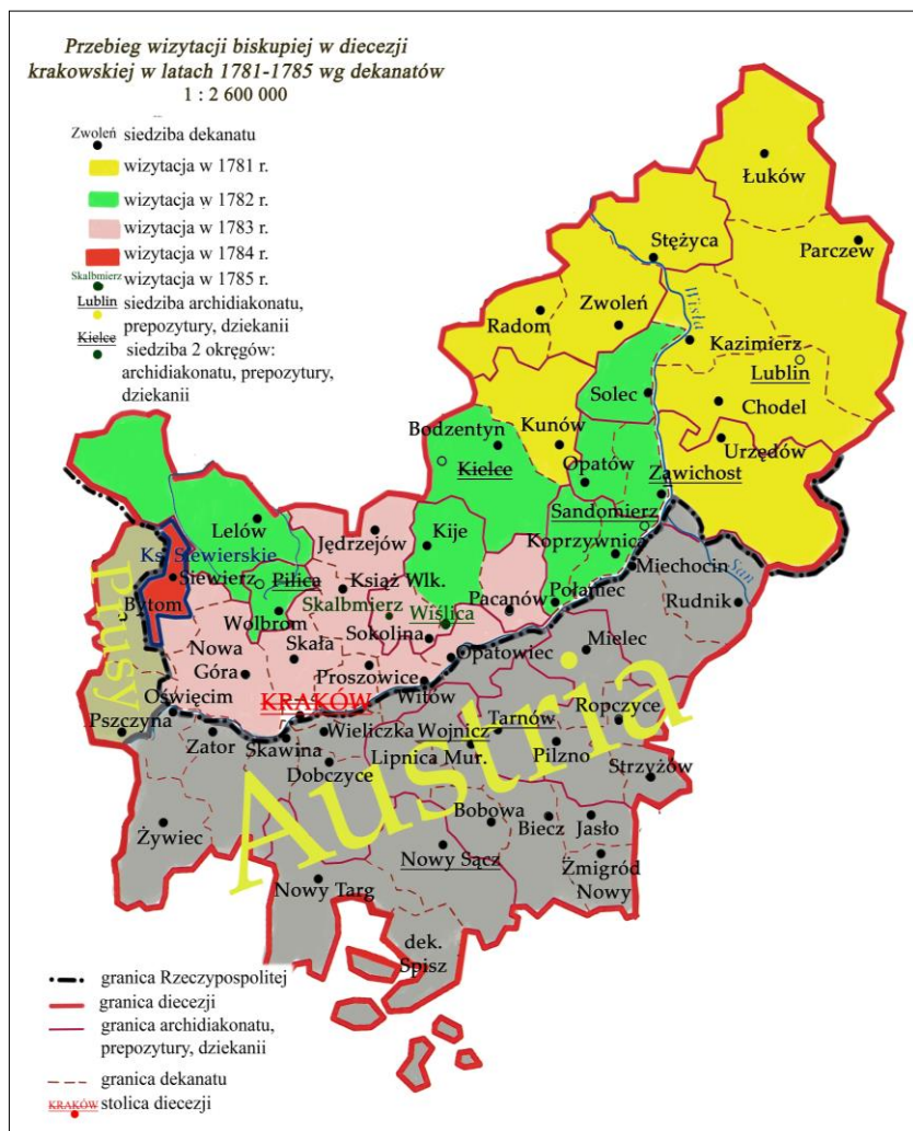
Mapa. 1. Przebieg wizytacji w diecezji krakowskiej 1781-1785