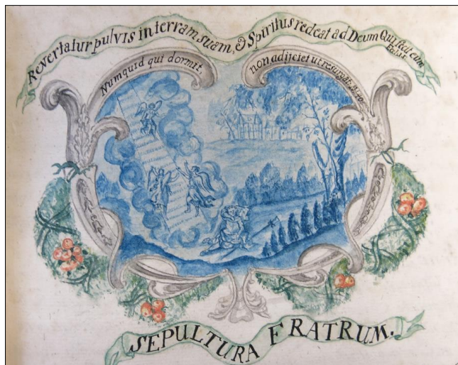
Zdj. 7. Pochówek Braci/ Wróci proch do ziemi swojej, a duch powróci do Boga, który go stworzył. (Koh 12,7) / Zali ten kto śpi, więcej nie powstanie