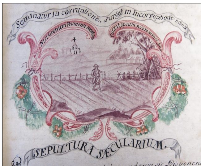
Zdj. 8. Pochówek Świeckich / Sieje się niechwalebne, powstaje chwalebne (1 Kor 15, 43) / Jeżeli ziarno pszenicy nie obumrze, zostanie tylko samo (J 12, 24)