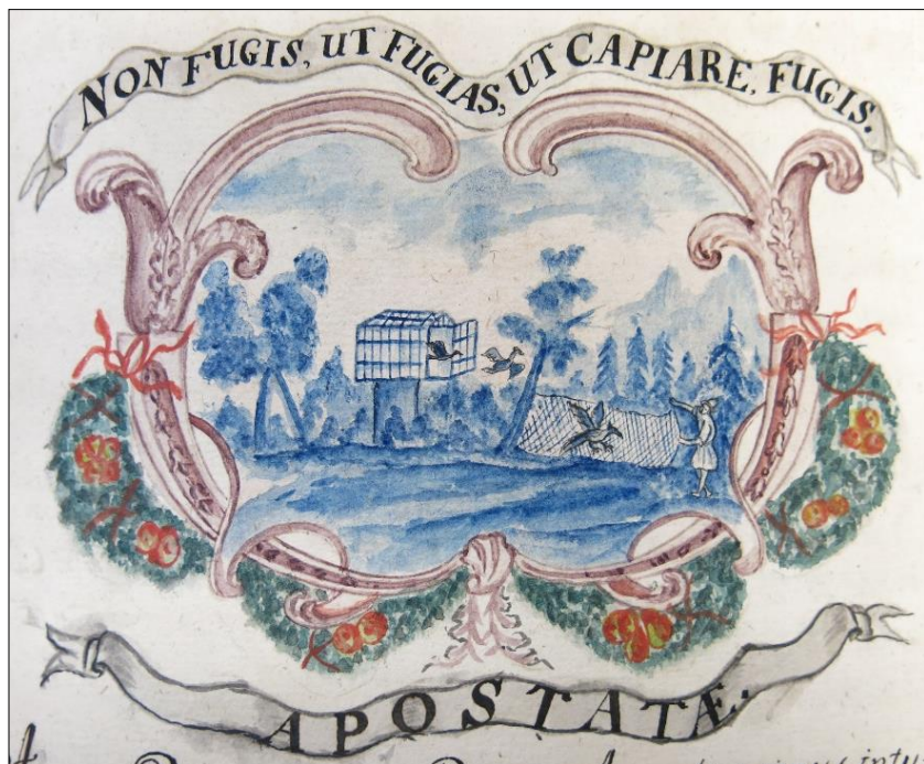
Zdj. 13. Apostaci/Nie uciekasz, aby uciec, uciekasz, aby zostać pochwyconym

Ta część kroniki obejmuje katalog apostatów od życia zakonnego 65 , których to przypadki reformackie prawo zakonne nakazywało skrupulatnie notować, spisom tym nadając charakter poufny 66 . Warto zaznaczyć, że pod pojęciem apostazji rozumiano wówczas samowolne opuszczenie klasztoru. W kronice klasztoru chełmskiego odnotowano sześć przypadków apostazji zakonnej z lat 1747-1774. Noty zawierają datę dzienną zdarzenia, imię i nazwisko zakonnika, i okoliczność