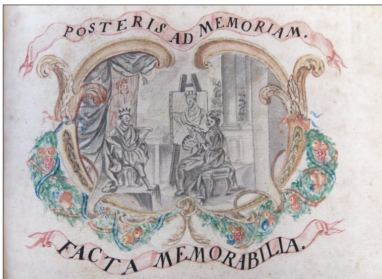
Zdj. 3. Potomnym ku pamięci/zdarzenia godne pamięci