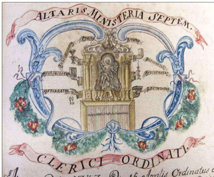
Zdj.11. Klerycy wyświęceni / Siedem posług przy oltarzu: diakoniat, akolitiat, lektorat, subdiakoniat, egzorcystat, ostiariat, prezbiterat