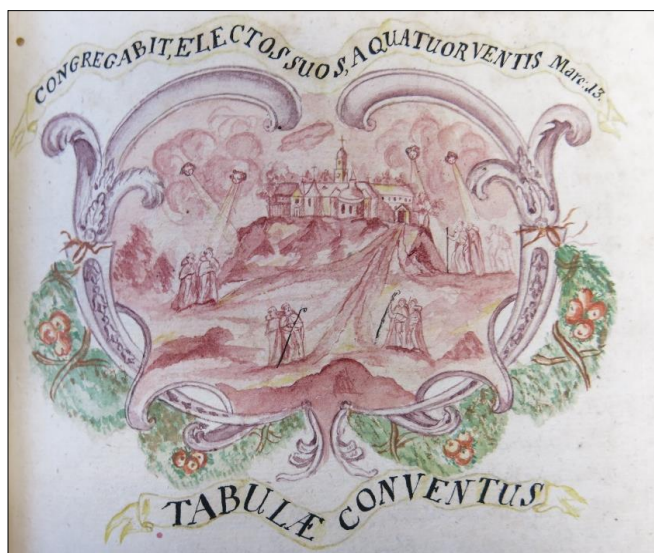
Zdj. 6. Tabulae Klasztoru/ Zbierze swoich wybranych z czterech stron świata (Mk13,27)