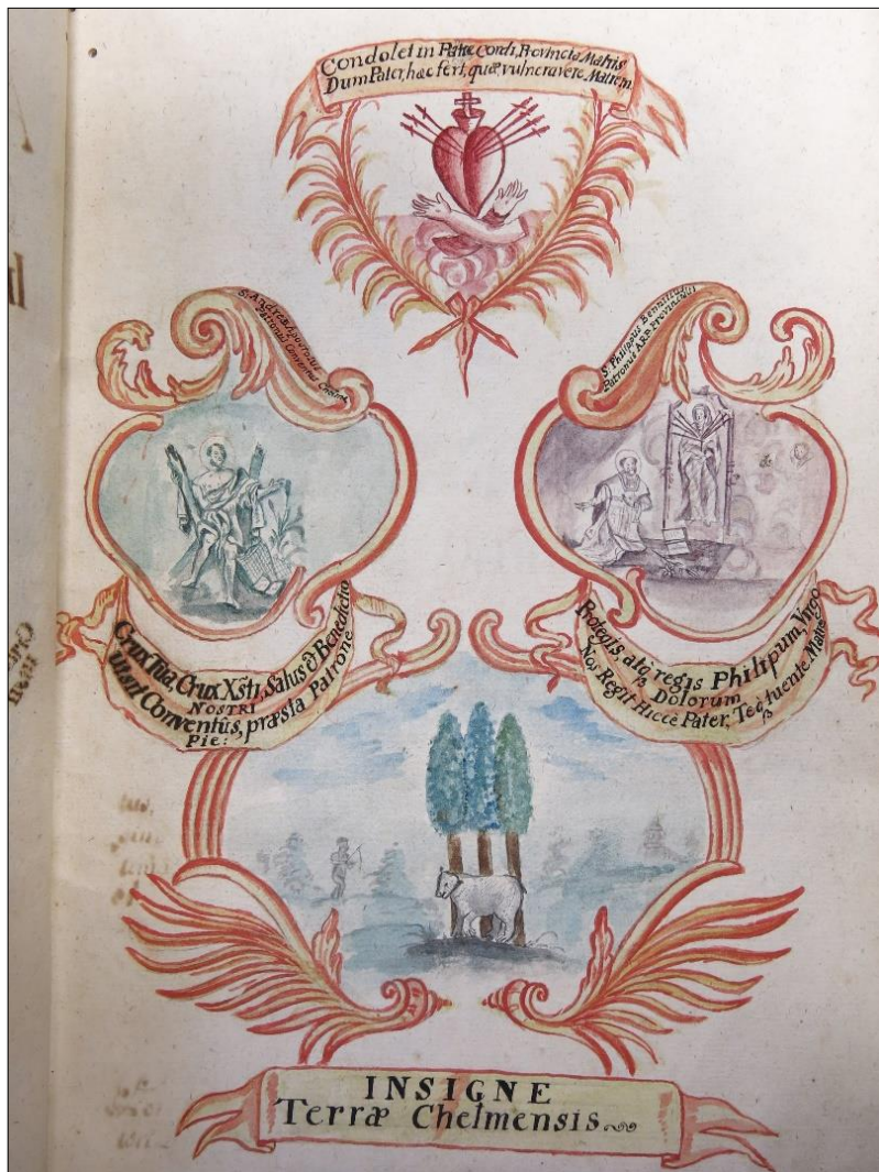
Zdj. 1. Prowincja Matki współczuje sercu Ojca, podczas gdy Ojciec przynosi to, co zraniło Matkę/ św. Andrzej Apostoł – Patron Konwentu Chełmskiego/ Spraw Święty Patronie, aby Krzyż Twój, Krzyż Chrystusa był ocaleniem i błogosławieństwem naszego konwentu/ Święty Filip Benicjusz Patron Przewielebnego Prowincjała/ Chroń i prowadź, Filipa, Dziewico, Ojciec ten nas prowadzi, pod Twoją ochroną Matko/ Herb Ziemi Chełmskiej