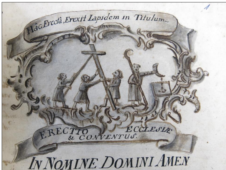
Zdj. 2. Wzniesienie Kościoła i Klasztoru/ Tę podniósłszy, wznioł kamień pod wezwaniem