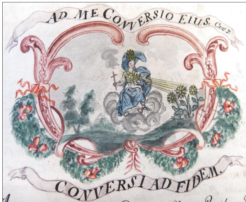
Zdj. 12. Nawróceni na wiarę / Ku mnie sie zwraca (Pnp 7, 11)

W katalogu „nawróconych na wiarę rzymskokatolicką” odnotowywano: datę dzienną, imię i nazwisko konwersa, narodowość, poprzednie wyznanie, oraz u kogo pełnił służbę. W opisie zawarto również następujące okoliczności zdarzenia: miejsce dokonanej konwersji, kto ją przyjmował i kto udzielał konwersowi absencji. Następnie neofita przyjmował Sakrament Komunii Świętej. Najwięcej odnotowanych w katalogu nawróceń, to nawrócenia z wiary luterańskiej i kalwińskiej, mniejszość przypadków stanowili konwersi z wyznania prawosławnego i mojżeszowego. Pod względem narodowości, wśród konwersów przeważali zdecydowanie Niemcy, choć kronikarz wymienił również Anglika, Węgra, Rusina 64 .