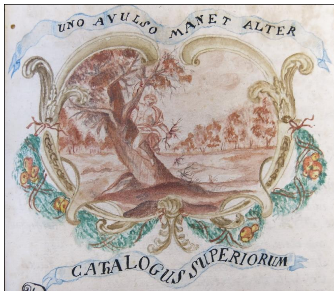
Zdj. 5. Katalog Przełożonych/ Gdy jeden odchodzi pozostaje drugi