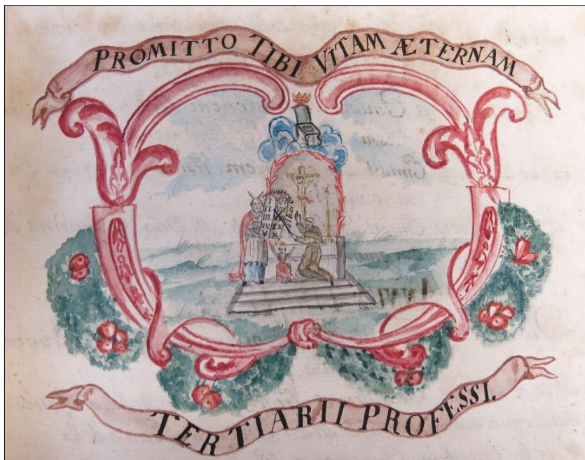
Zdj. 10. Tercjarze Profesi / Obiecuję tobie życie wieczne

Katalog przyjętych do III Zakonu został ułożony chronologicznie: w obrębie roku, pod datą dzienną odnotowano imię i nazwisko obłóczonego. W przypadku mężczyzn podawano pełniony urząd, w przypadku kobiet stan cywilny. Większość wstępujących do wspólnoty tercjarzkiej stanowiła średnia i drobna szlachta.