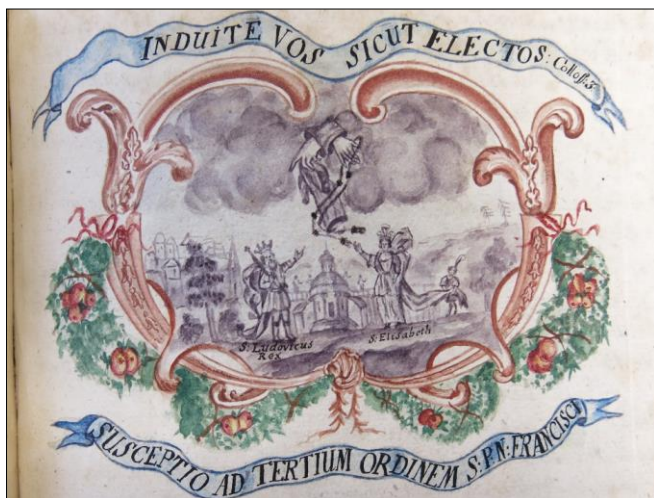
Zdj. 9. Przyjęcie do Trzeciego Zakonu Przenajświętszego Ojca Naszego Franciszka / Jako wybrańcy obłeczcie się, (Kol 3, 12)

Dwa kolejne działy Archiwum dotyczą tercjarzy franciszkańskich i obejmują katalog obłóczonych (przyjętych do III zakonu) oraz katalog profesji tercjarских.