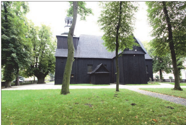
Il. 2. Kościół pw. św. Andrzeja, Brody Poznańskie, 1673. Bryła, widok od południa