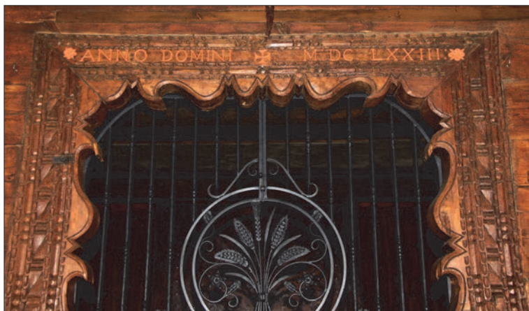
Il. 5. Kościół pw. św. Andrzeja, Brody Poznańskie, 1673. Portal główny (zachodni), fot. Aleksander Jankowski