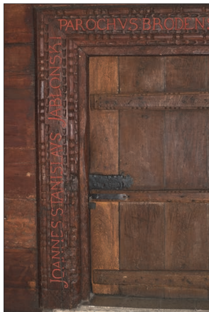
Il. 6. Kościół pw. św. Andrzeja, Brody Poznańskie, 1673. Portal południowy, fot. Aleksander Jankowski