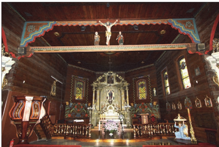
Il. 3. Kościół pw. św. Andrzeja, Brody Poznańskie, 1673. Wnętrze, widok na ołtarz główny. Podciąg i belka tęczowa, fot. Aleksander Jankowski