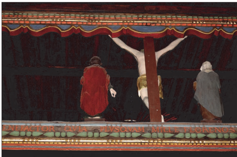
Il. 4. Kościół pw. św. Andrzeja, Brody Poznańskie, 1673. Inskrypcja ciesielska na belce tęczowej (fragment)