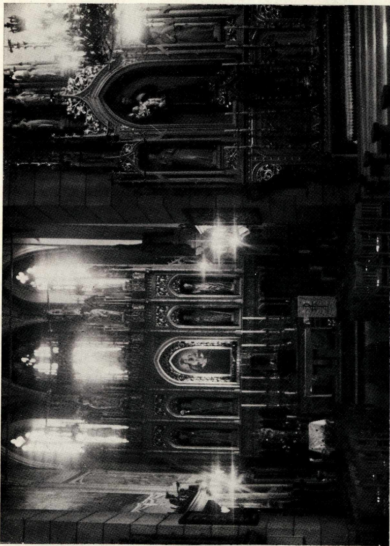
3. Wnętrze kościoła franciszkańskiego w Krośnie

Krośnie zamieszkałym przez Polaków. Dopiero w 1400 roku po spaleniu się klasztoru przenieśli się do królewskiego miasta Krosna. W lokowanym na prawie niemieckim Krośnie osadnicy niemieccy skupili się przy farze. W kościele farnym znajdowała się kaplica niemiecka, nazwana później Szkaplerzną. Część patrycjatu utrzymywała kaznodzieję niemieckiego 103 .