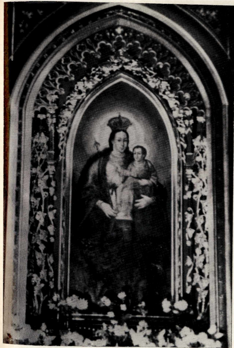
4. Obraz Matki Boskiej Murkowej (Krośnieńskiej)

Kościół franciszkański w Krośnie, dzięki obrazowi Matki Boskiej Murkowej, stał się duchowym ośrodkiem promieniującym na miasto i okolice. Czczyciele Najświętszej Maryi Panny nawiedzali kaplicę Murkową przez cały rok, o czym świadczą drobne ofiary składane do skarbonki w tejże kaplicy. Zamożniejsi dawali wota na obraz. Na ścianach umieszczono malowidła na tablicach, przedstawiające otrzymane łaski za pośrednictwem Najświętszej Maryi Panny przy Jej obrazie Murkowym. Kult tego wizerunku Matki Bożej objął znaczne terytorium. Do kościoła franciszkańskiego w Krośnie przybywali pątnicy, pojedynczo lub z rodzinami i znajomymi, z odległych nawet miejscowości Podkarpacia i Karpat. Pielgrzymi modlili się przed obrazem Matki Boskiej Murkowej, uczestniczyli we mszy świętej i innych nabożeństwach, spowiadali się i przystępowali do Komunii św. Pielgrzymi twierdzili, że „osobliwsze łaski doznali Najśw. Panny Murkowej” 156 . W XVIII