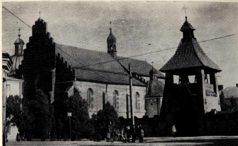
1. Widok kościoła franciszkańskiego w Krośnie od ul. Franciszkańskiej.