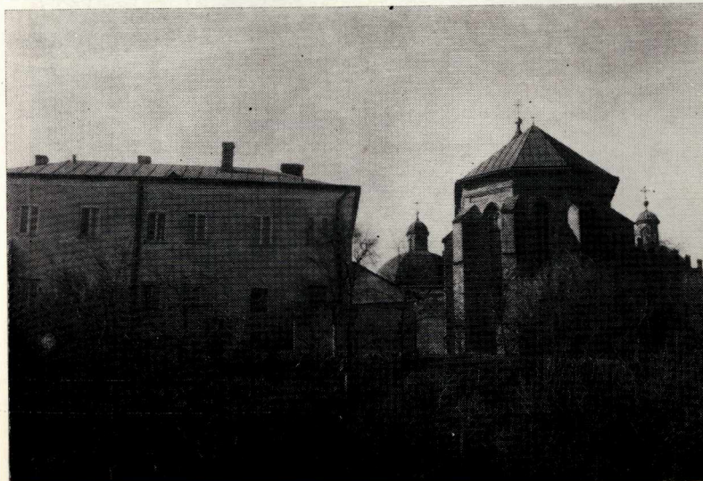
2. Widok kościoła i klasztoru franciszkańskiego w Krośnie od strony południowo-wschodniej.