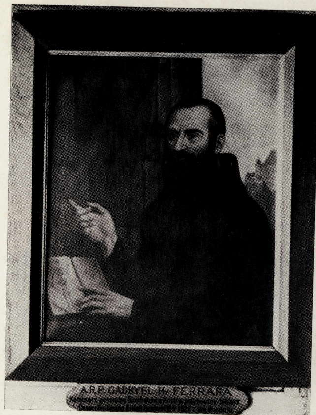
16. Brat Gabriel-Kamil hrabia Ferrary (ok. 1543—1627), obraz w domu Bonifratrów w Krakowie