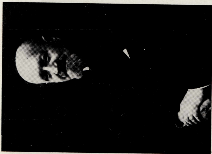
19. Stanisław Rzegociński (1875—1933)