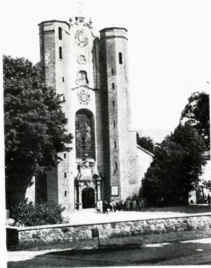
Katedra w Gdańsku-Oliwie