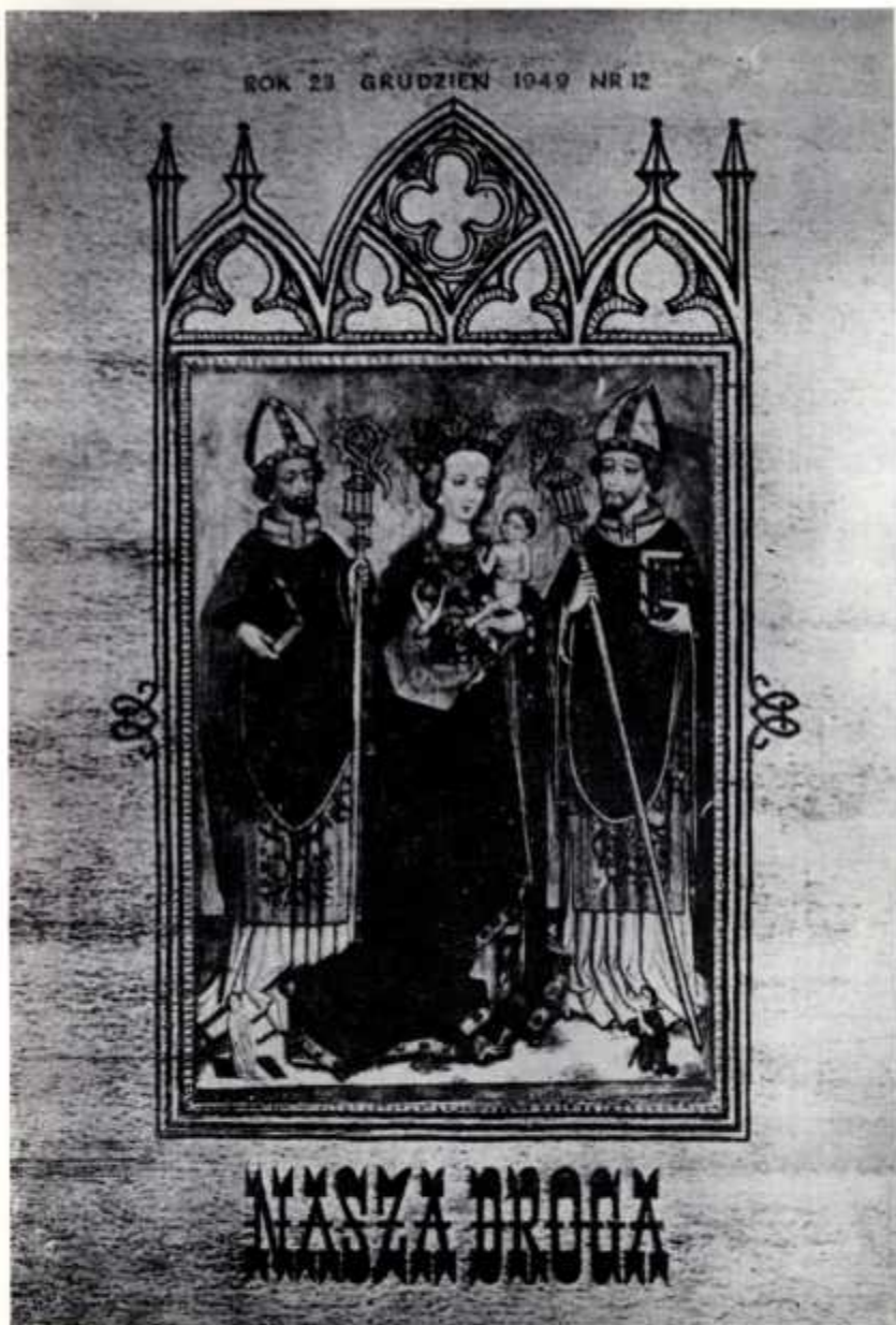
8. Strona tytułowa „Naszej Drogi” nr 12 (1949)