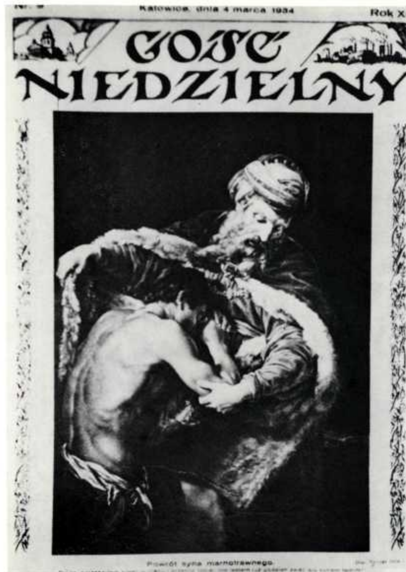
3. Strona tytułowa tyg. „Gość Niedzielny” (nr 9 z 4 III 1934 r.)