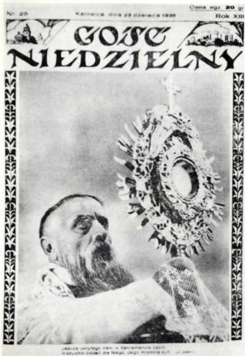
4. Strona tytułowa tyg. „Goście Niedzielny” (nr 25 z 23 VI 1935 r.)