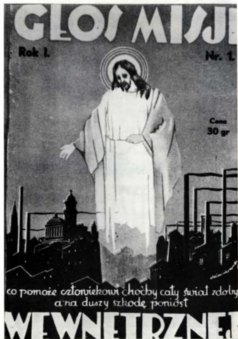
5. Strona tytułowa mies. „Głos Misji Wewnętrznej” nr 1 (maj) z 1932 r.