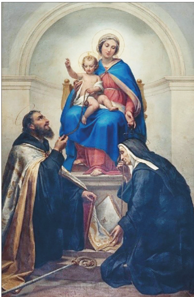
Fot. 2. Matka Boska Paskowa ze św. Augustynem i św. Moniką. Corneto, kościół S. Maria di Valverde, mal. Pietro Gagliardi