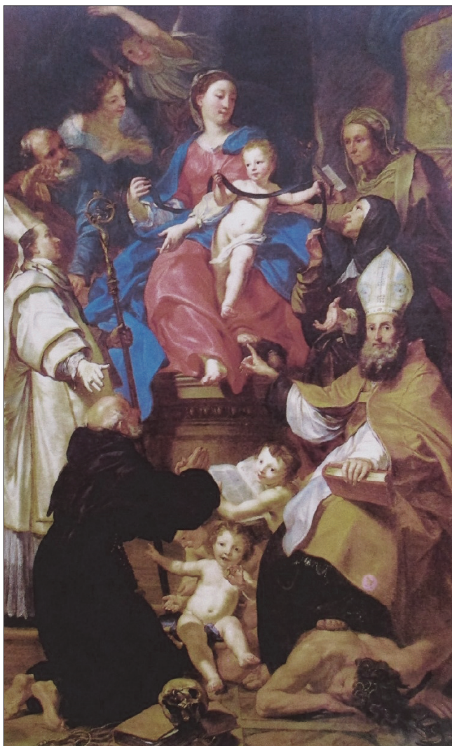
Fot. 3. Matka Boska Paskowa ze świętymi: Augustynem, Moniką, Anną, Mikołajem z Tolentino, Tomaszem z Villanuevy i Joachimem, Genua. Biały Pałac, mal. Lorenzo De Ferrari