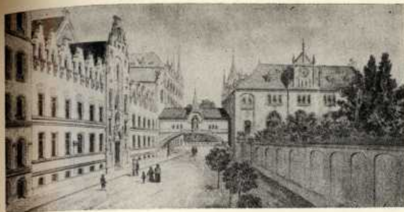
5. Wrocław, ul. św. Józefa z byłym Domem Generalnym (po lewej stronie) i Nowicjatem (po prawej) z przejściem nadulicznym.