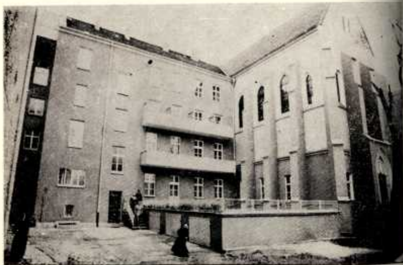
8. Odbudowany w latach 1948—1978 były Dom Generalny obecnie Dom Prowincjalny we Wrocławiu (od strony podwórza) z kaplicą Matki Boskiej Częstochowskiej.