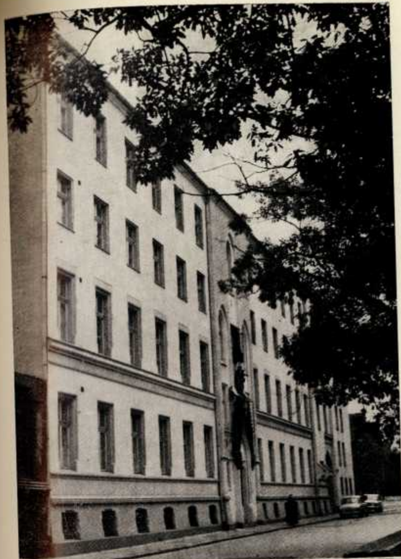
9. Odbudowany po zniszczenia wojennych były Dom Generalny, od 1974 r. Dom Prowincjalny we Wrocławiu.