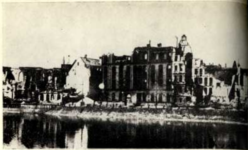
7. Były Szpital św. Józefa we Wrocławiu — w gruzach, obecnie całkowicie rozebrany.