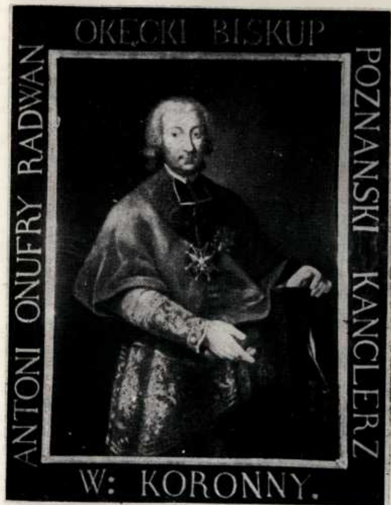
Portret z katedry w Warszawie