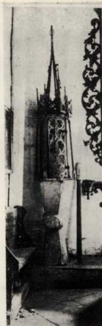
Tabl. I. Późnogotyckie cyborium w kościółku drewnianym w Skalnicy