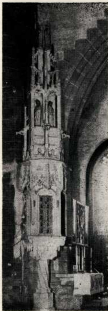
Tabl. II. Kamienne cyborium w kościele parafialnym w Bardłowie