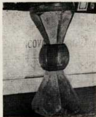
Chrzcielnica w kościele w Harvartowie