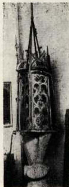
Cyborium drewniane w Skalniču