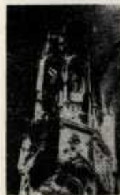
Zwieńczenie cyborium w Bardłowie