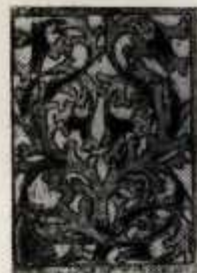
Dekoracja zaplecka stali w Strażakach na Spiszu