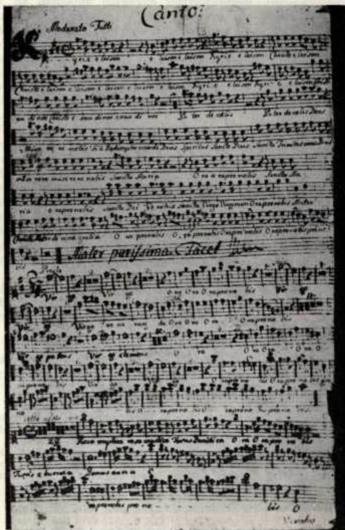
24. Kompozycja Litanii loretańskiej, wykonywana przez kapelę i chór przy kościele świętogórskim