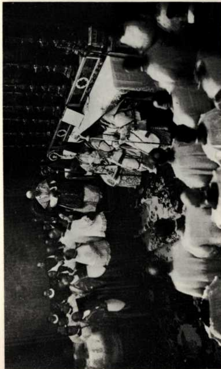
34. Konsekracja ks. biskupa Adama S. Sapięchy w kaplicy Sykstyńskiej w Rzymie, dn. 17 XII 1911 r. (w głębi na tronie konsekurator — papież Pius X)