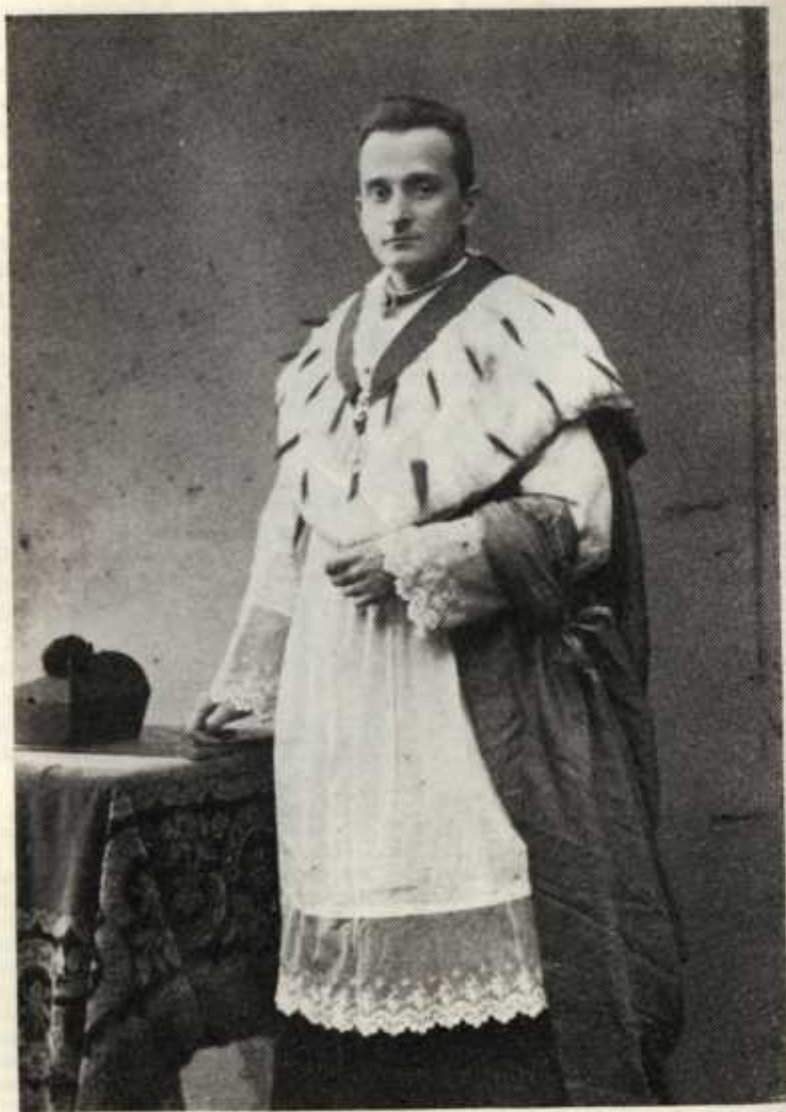
33. Ks. Adam S. Sapieha (1906)