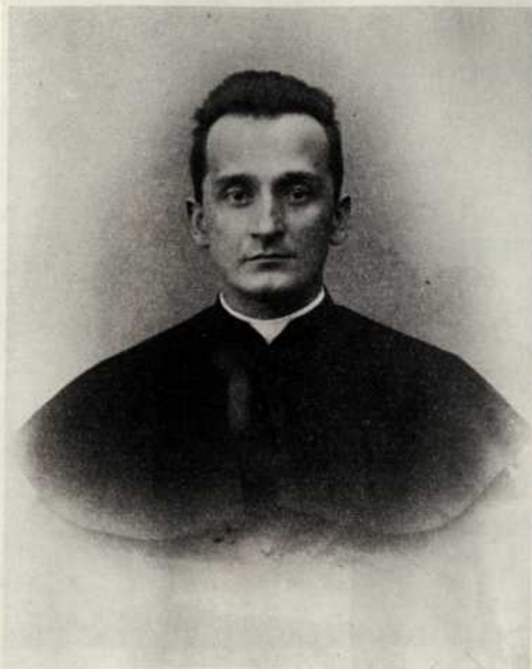
32. Ks. Adam Stefan Sapieha (1906)