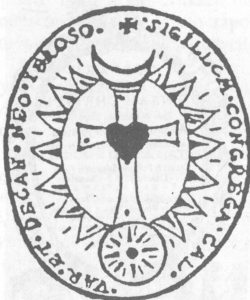
Pieczęć Góry Kalwarii z końca XVII w.

„Że Mazowieckie tłumy zgromadzone, Miłością przeciw Bogu (do Boga) pobudzone Na długie czasy, y potomne lata, Będą rozmyślać odkupienie świata” 29 .