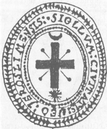
Pieczęć miasta Góra Kalwaria z roku 1816.