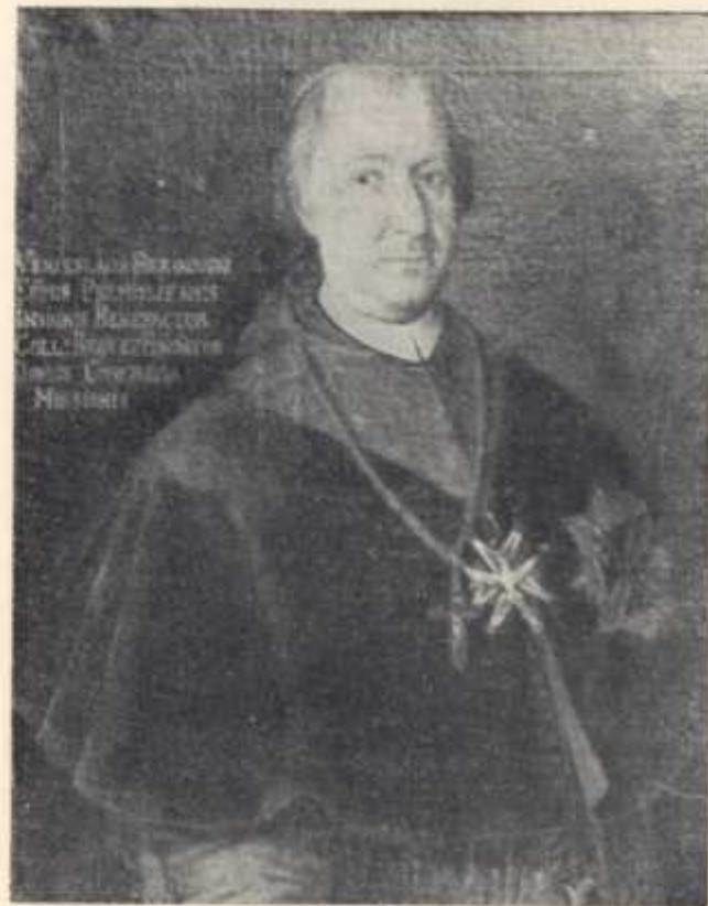
Bp Wacław Hieronim Sierakowski (1742—1760) Fundator misjonarzy w Brzozowie