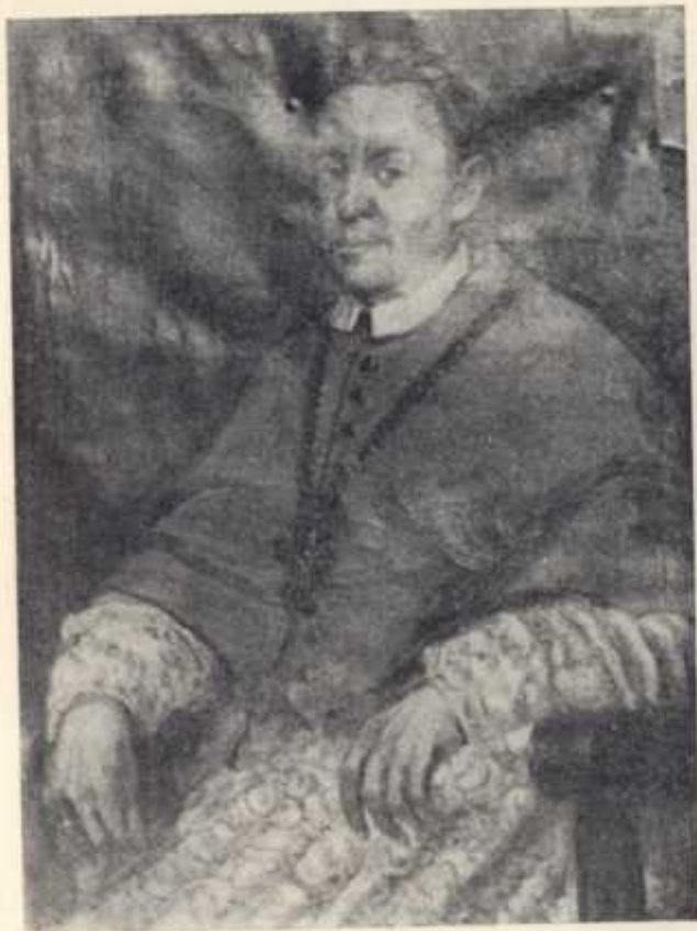
Bp Aleksander Antoni Fredro (1724—1734)