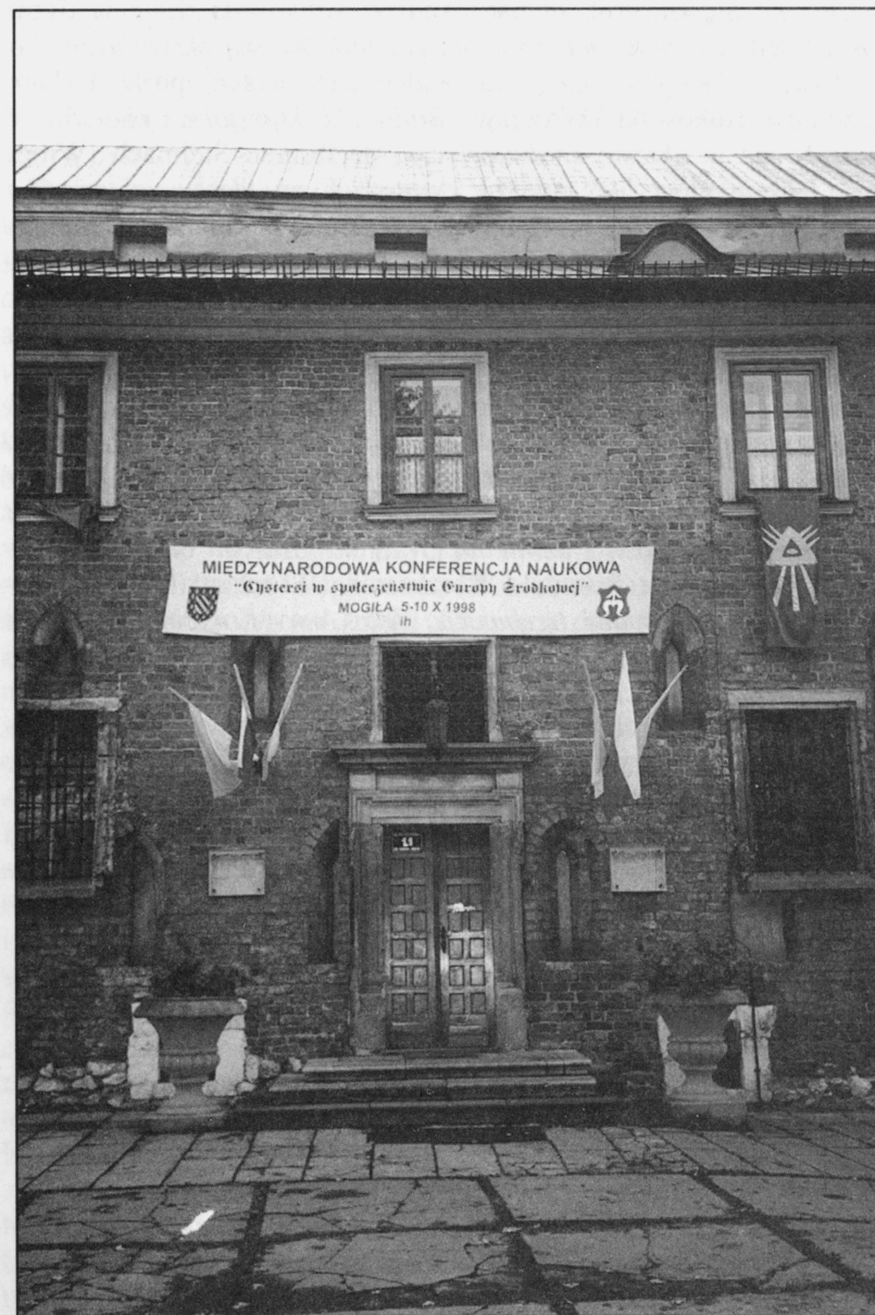
3. Fragment zachodniego skrzydła klasztoru mogińskiego w dniu otwarcia obrad konferencji.

W trzecim dniu obrad problematyka wykładów związana był z różnymi problemami dziejów i działalności kulturalnej cystersów na Śląsku (sesja przedpołudniowa) i w Małopolsce (sesja popołudniowa). Odnośnie do klasztorów śląskich prof. dr hab. Róścisław Żerelik (Wrocław) omówił Średniowieczne archiwalia cy-