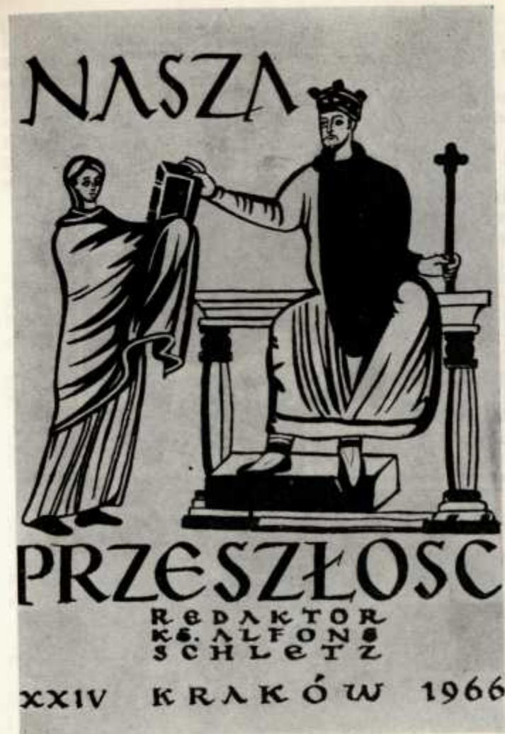
5. Okładka milenijnego (XXIV) tomu „Naszej Przeszłości”