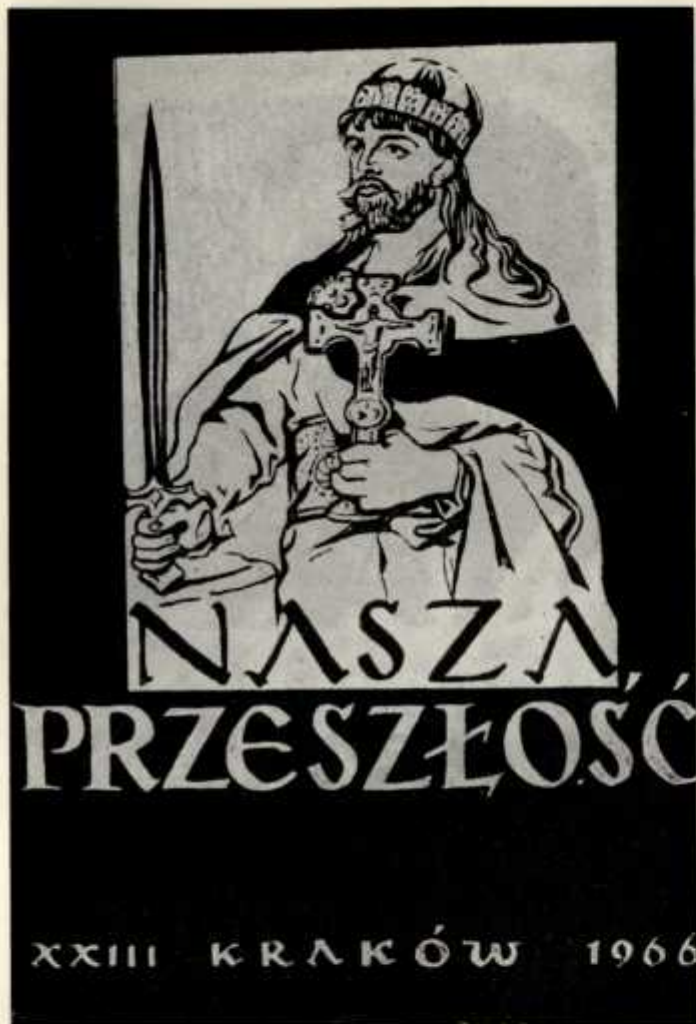
4. Okładka milenijnego (XXIII) tomu „Naszej Przeszości”