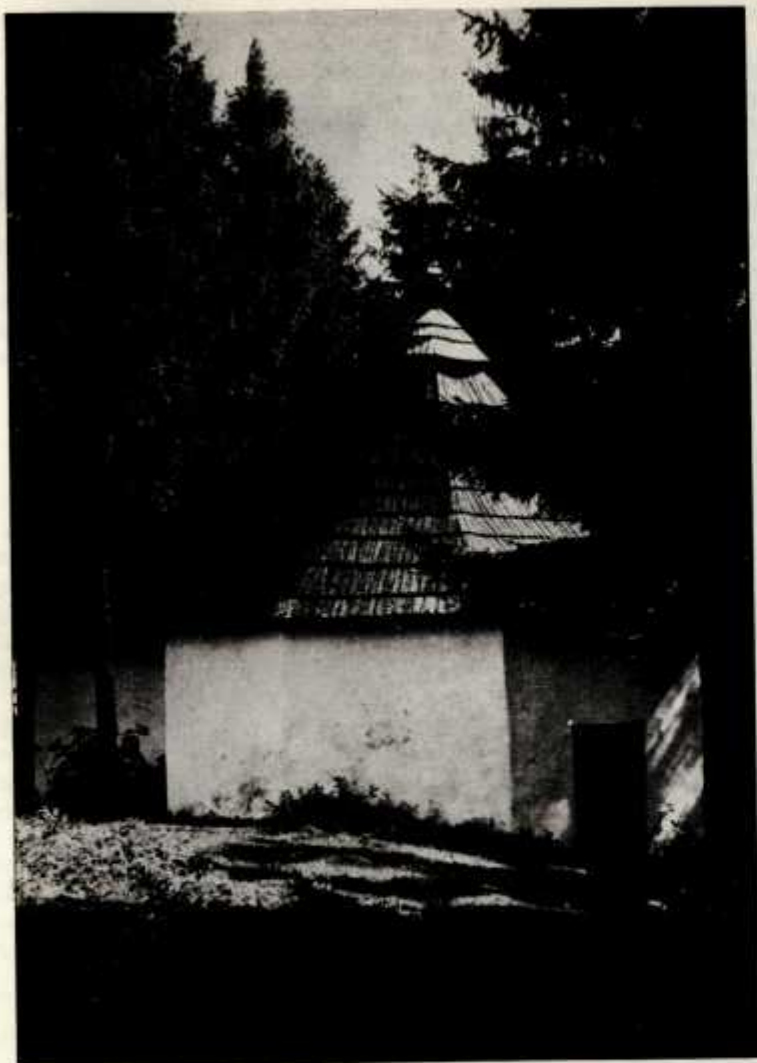
20. Niedzica, kaplica św. Michała

na rok 1872 wynosił 487 florenów i 76 xr" 37 . O Łapszach Niżnych są częste wzmianki, nawet bardzo liczne w księgach kasowych Niedzicy; przy okazji wypłacania zapomogi dla biednych. I wreszcie w zestawieniu kasowym na rok 1889/90 wymieniając sumy fundacyjne: