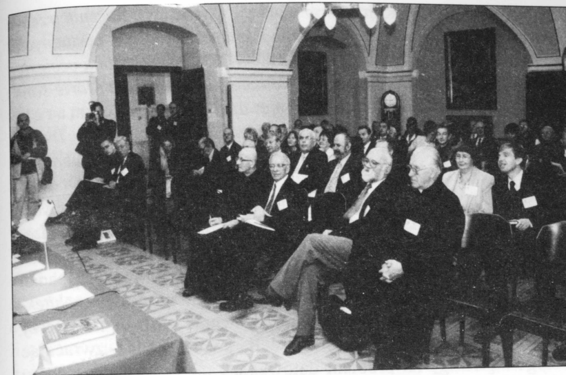
5. Sala obrad w klasztorze trzebnickim.