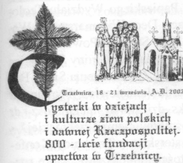
1. Logo sesji, opr. L. Wróblewski

Sesja została zorganizowana przez Zespół do badań nad historią i kulturą cystersów w Polsce działający