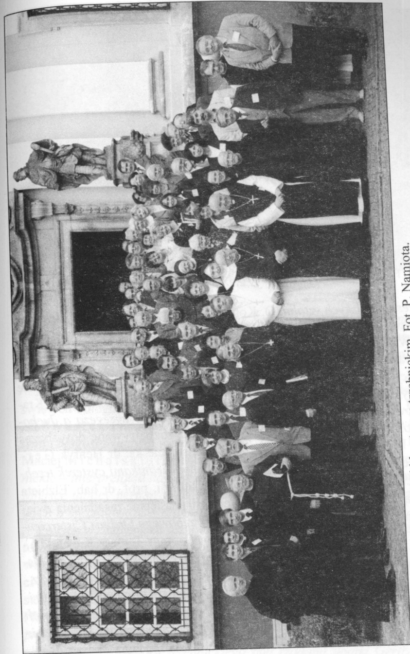
3. Uczestnicy konferencji przed klasztorem trzebnickim.