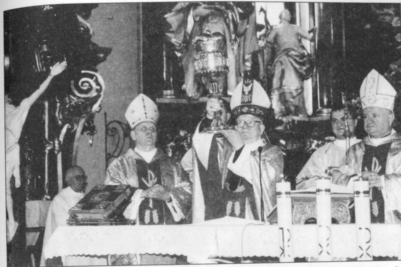
2. Jubileuszowa, koncelebrowana msza św. w bazylice św. Jadwigi w Trzebnicy.