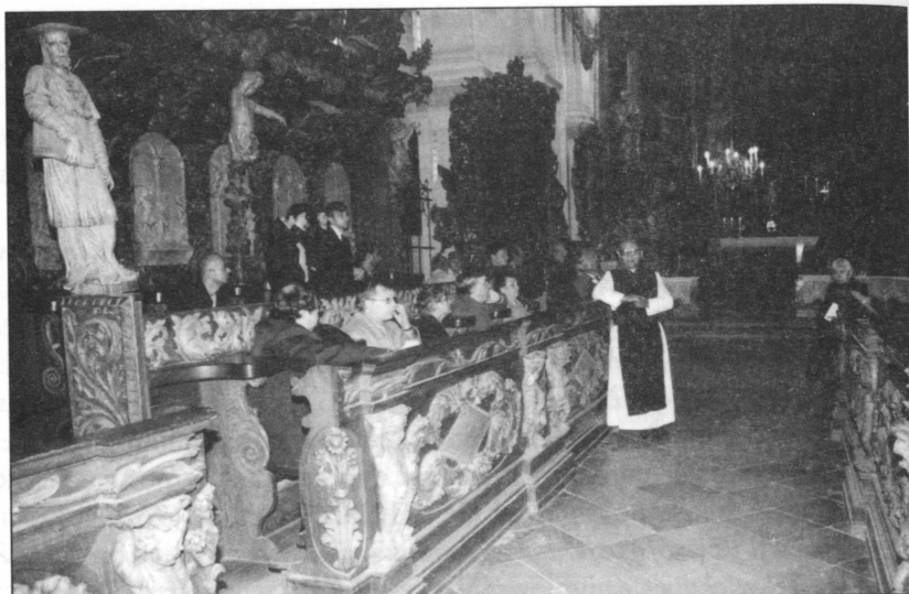
6. Uczestnicy sesji w stallach klasztoru w Henrykowie.